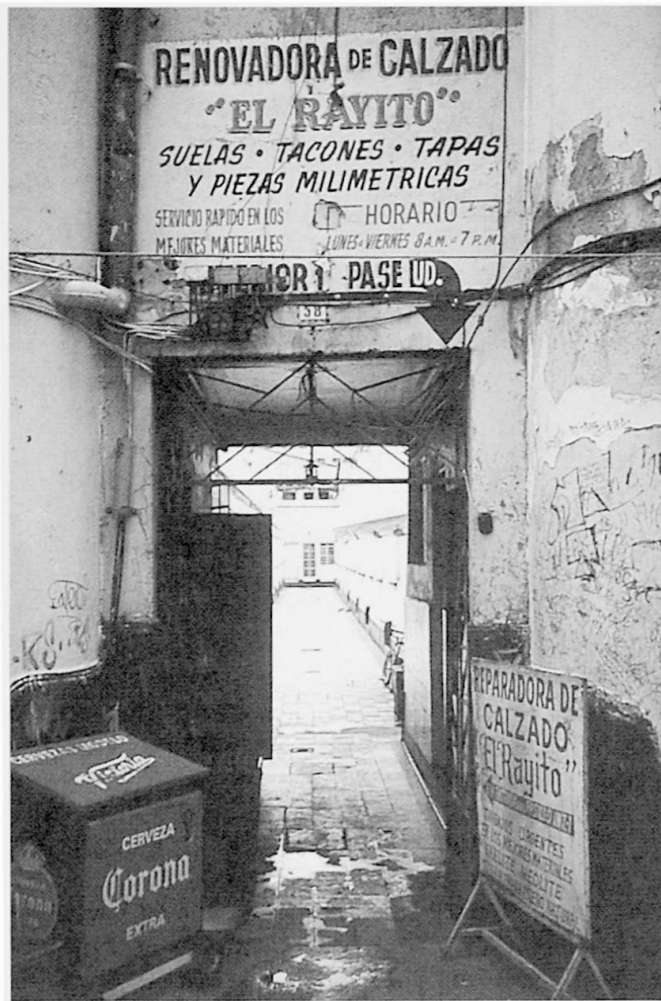
Foto 2: Vecindad in Mexiko-Stadt: Ein einziges Tor verschliesst den Zugang zu den Wohneinheiten.

« Vecindad » in Mexico City: The complex can only be entered through the main gates.