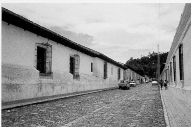
Foto 1: Strasse in Antigua Guatemala: Der öffentliche Raum ist vom privaten strikt getrennt. Urban road in Antigua Guatemala: Public and private space are strictly separated from each other. Rue urbaine à Antigua Guatemala: l'espace public est strictement séparé de l'espace privé.

Diese Patio-Häuser waren aber jeweils eine Wohneinheit und entsprachen oder entsprechen daher nicht der Definition von barrios cerrados . Dennoch gab es auch in der Kolonialstadt bereits solche geschlossene, nur den Bewohnern zugängliche Viertel. Die «Klosterstadt» Santa Catalina in Arequipa, das Jesuitenseminar in Tepotzotlán, das Hospitolio Cabañas in Guadalajara (das freilich erst um die Jahrhundertwende 19.-20. Jh. entstand), sind Beispiele für Stadtviertel von beachtlicher Größe, die Frauen, Witwen, Semina-