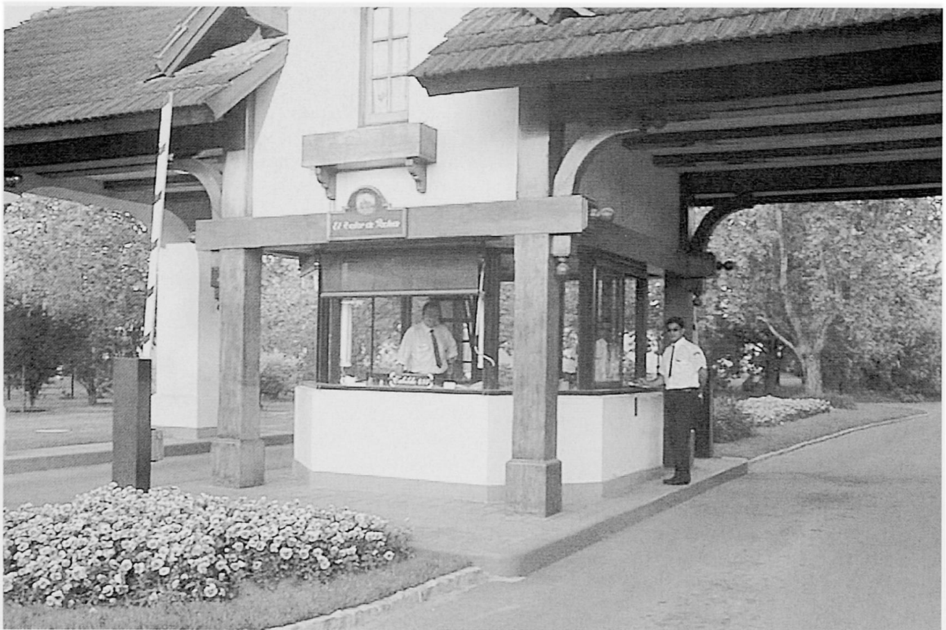
Foto 2: Repräsentative Einfahrten charakterisieren den Status von Country Clubs der oberen Mittelschicht.

Representative entrance gates characterize the status of upper middle class Country Clubs.