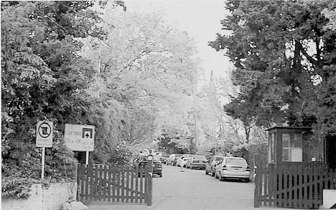
Foto 1: Immer mehr Wohngebiete der Oberschicht werden – oftmals illegal – nachträglich abgesperrt. More and more neighbourhoods of the upper classes are enclosed – in most cases illegally. Un nombre croissant d'aires résidentielles sont encloses – souvent illégalement – au bénéfice des couches supérieures de la population.