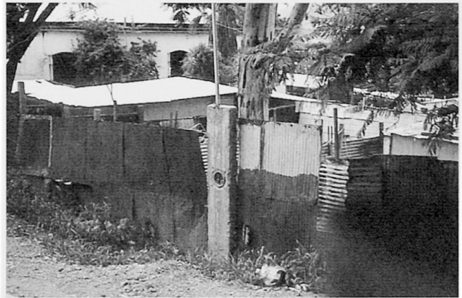
Foto 3: Marginalviertel ( barrio perdido ) in Mexiko-Stadt: Auch die Hüttenviertel sind auf ihre Art umzäunt.

Die Hüttenviertel haben zu einem großen Teil in den letzten Jahrzehnten einen beachtlichen Konsolidierungsprozess durchlaufen. Auch sie wurden vom Trend zur Einfriedung erfasst und sind heute vielfach umzäunt (Foto 3). Wo eine Konsolidierung stattfand, sind die ehemaligen Hütten modernen Gebäuden (oft in Stahlbeton-Skelettbauweise mit gemauerten Wänden) gewichen, die Straßen sind ebenfalls befestigt, Infrastruktur zur Ver- und Entsorgung, Bildungseinrichtungen, Einzelhandel und vielfältige Dienst-