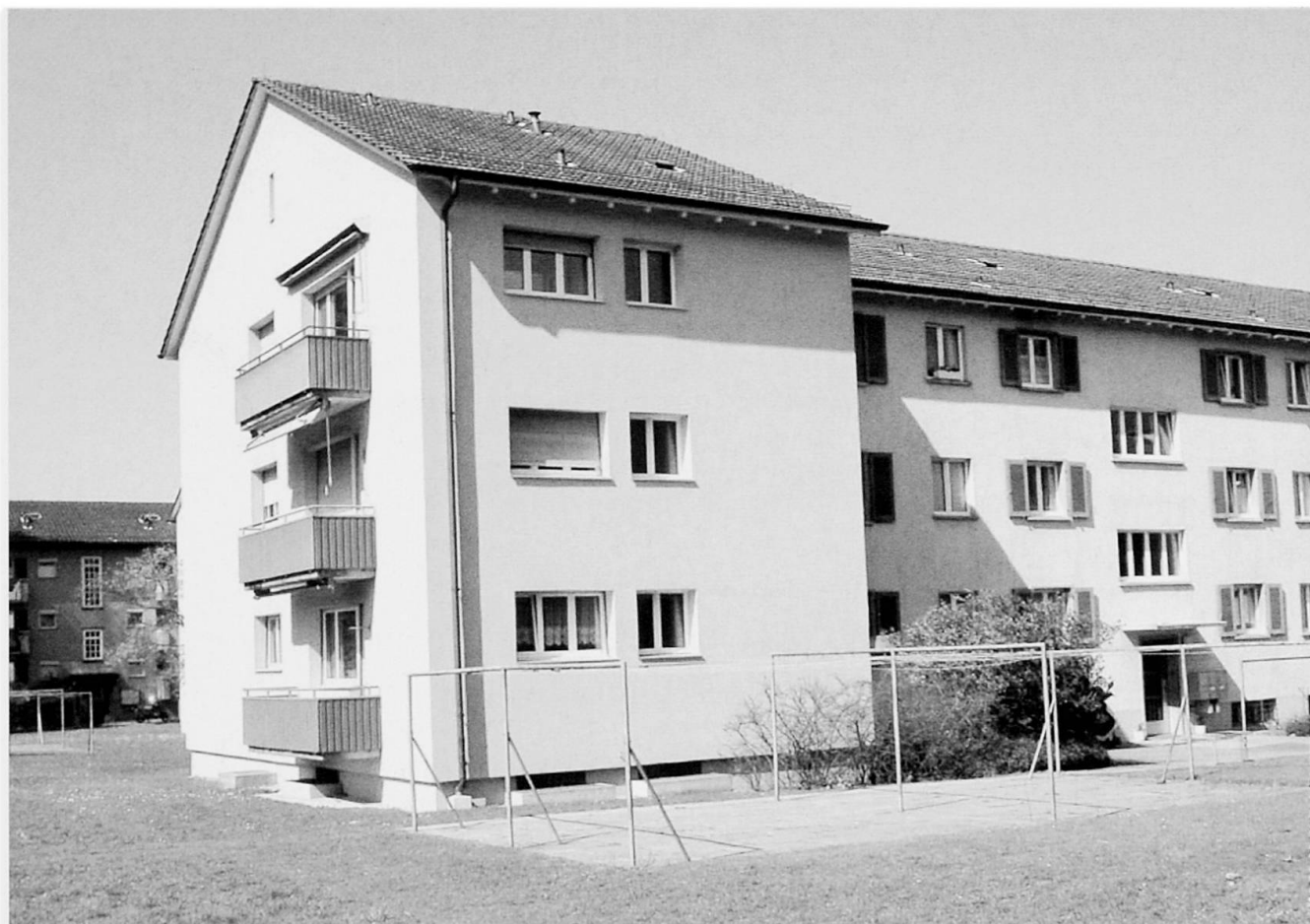
Foto 1: Typähnliches Bild für Wohnbaugenossenschaft A A representative image of communal housing development A Vue typique du bâti de la coopérative de construction A