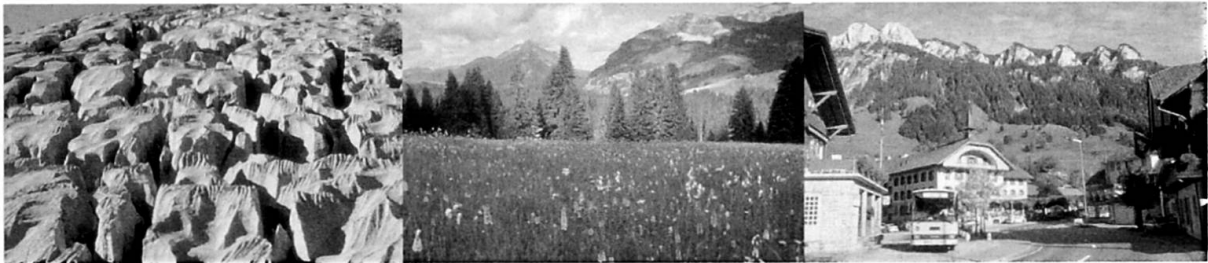
Abb. 1: Zonierung der UNESCO Biosphäre Entlebuch (UBE) (Foto 1: Kernzone: Naturschutzgebiet Schrattenfluh; Foto 2: Pflegezone: Moorlandschaft Habkern/Sörenberg; Foto 3: Entwicklungszone: Dorfzentrum Flühli) Zonation of UNESCO Biosphere Reserve Entlebuch (UBE) (Photo 1: Core Area: nature conservation area of Schrattenfluh; Photo 2: Buffer Zone: moorlands of Habkern/Sörenberg; Photo 3: Transition Area: centre of Flühli) Zonage de «UNESCO Biosphère Entlebuch» (UBE) (Photo 1: Aire centrale: réserve naturelle protégée Schrattenfluh; Photo 2: Zone tampon: Paysage marécageux Habkern/Sörenberg; Photo 3: Aire de transition: centre villageois de Flühli)