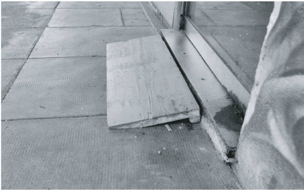
Photo 2: Une rampe en bois destinée à améliorer l'accès aux personnes handicapées

A wooden ramp for improving the access of the disabled persons