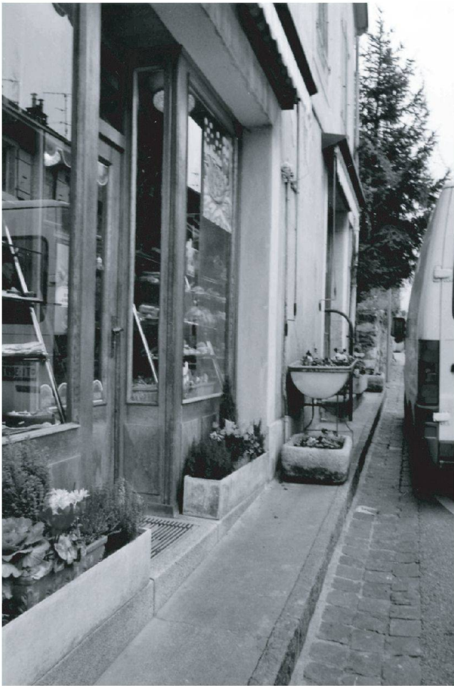
Photo 3: Trottoir trop étroit pour les chaises roulantes Sidewalk too narrow for wheelchairs Zu schmales Trottoir für Rollstuhlfahrer