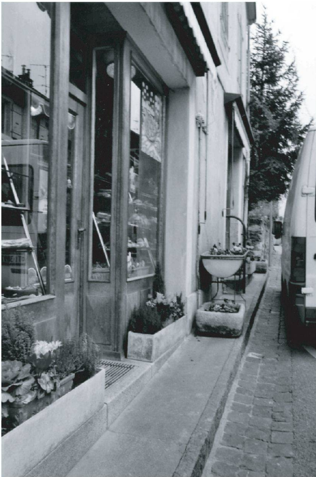
Photo 3: Trottoir trop étroit pour les chaises roulantes Sidewalk too narrow for wheelchairs Zu schmales Trottoir für Rollstuhlfahrer