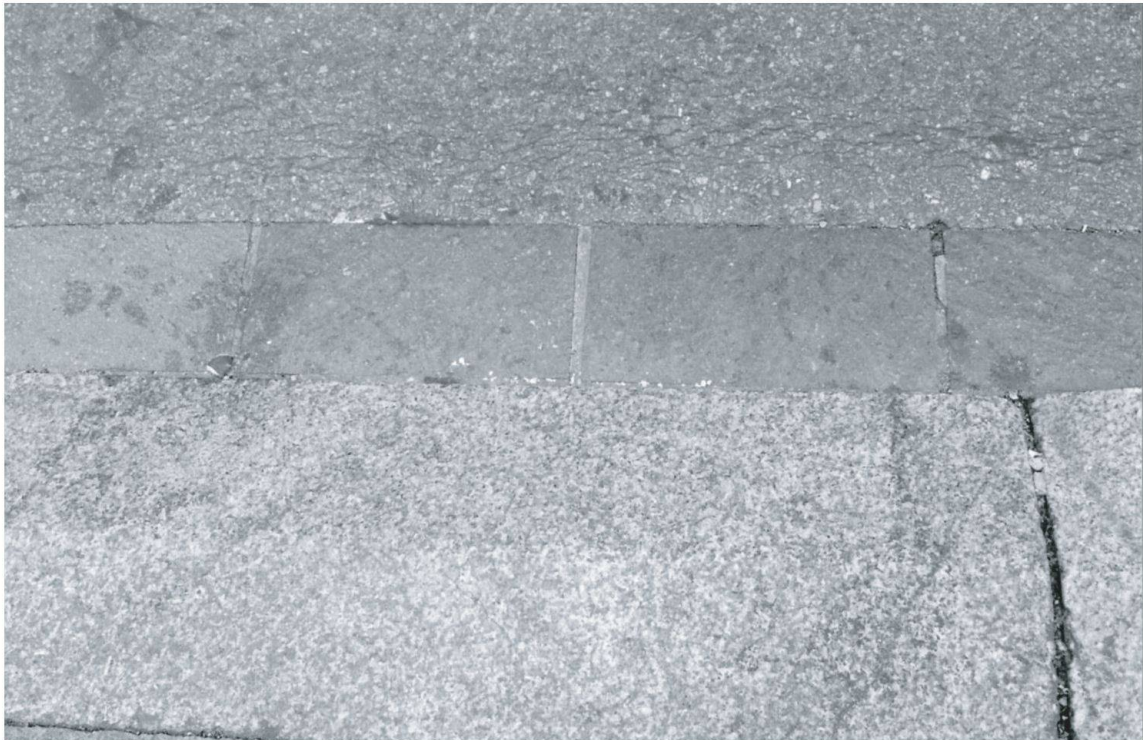
Photo 4: Les personnes à vue faible ne voient pas les extrémités de ce trottoir.

The people who suffer from poor sight do not see the border of this sidewalk.