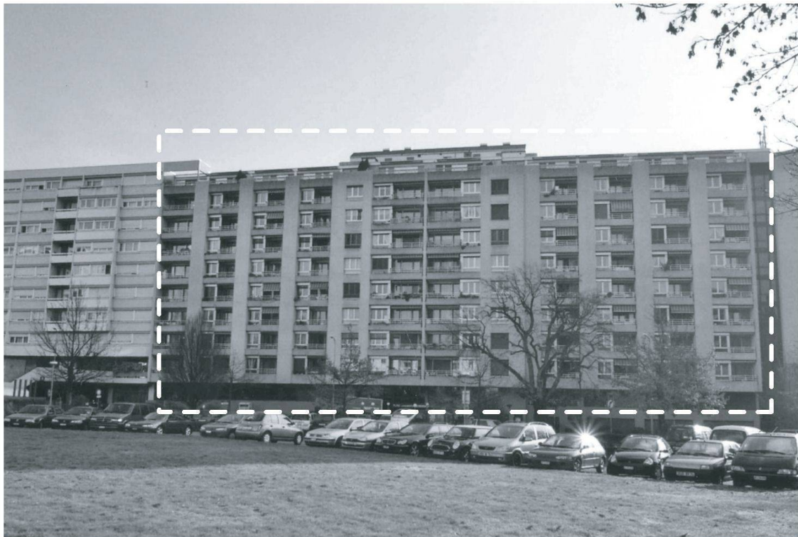
Photo 1: Appartements pour personnes âgées localisés dans un groupe d'immeubles intergénérationnel Block of flats for retired people located in a group of buildings catering for all generations Alterswohnungen in einer Wohnsiedlung