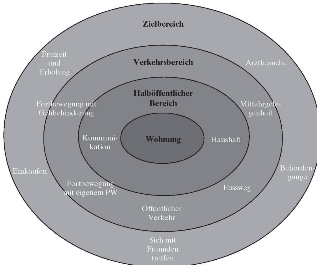
Abb. 2: Räumliches Umfeld im Alter Spatial environment of the elderly Contexte spatial des personnes âgées

Viele alte Menschen wünschen sich eine möglichst aktive und selbständige Nutzung des räumlichen Gefüges (FRIEDRICH 1995: 79), weshalb auch der öffentliche Raum für Betagte selbständig und möglichst gefahrlos zugänglich sein sollte. Ein selbständiges Sich-Zurechtfinden im öffentlichen Raum hängt daher wesentlich von der Nähe zu Infrastruktureinrichtungen wie Einkaufsmöglichkeiten, Ämtern oder öffentlichen Verkehrsmitteln ab. Eine verallgemeinernde Unterstellung von Gebrechlichkeit sollte aber vermieden werden, weil sie einer einseitig das Biologische betonenden Betrachtungsweise Vorschub leistet, auf deren Basis vor allem die Nähe zu Einrichtungen des Gesundheitswesens gefordert wird (LANDOLT 1999: 18). Vermeintliche Standortpräferenzen wie «Ruhe» oder «schöne Aussicht» in den Planungsprozessen öffentlicher wie privatrechtlicher Bauprojekte sind den Erkenntnissen der Altersforschung anzupassen.