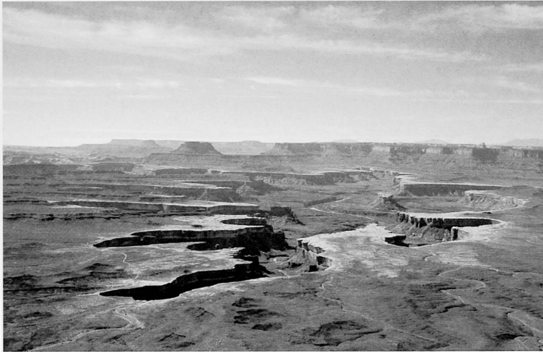
Foto 1: Blick auf den Greenriver im Canyonlands Nationalpark, Südost-Utah View of the Green River in Canyonlands Nationalpark, southeast Utah Vue sur Greenriver, dans le Parc national du Canyonland, au sud-est de l'Utah