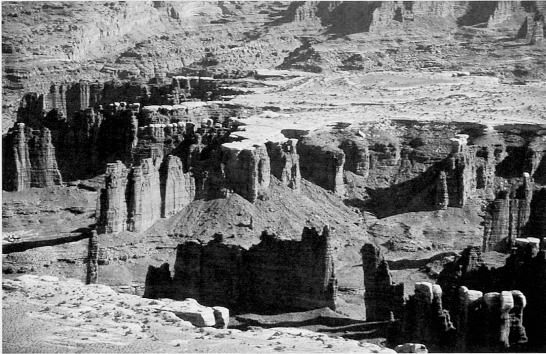
Foto 2: Erosionsformen im Canyonlands Nationalpark, Südost-Utah Rock erosion in Canyonlands Nationalpark, southeast Utah Formes d'érosion dans le Parc national du Canyonland, au sud-est de l'Utah