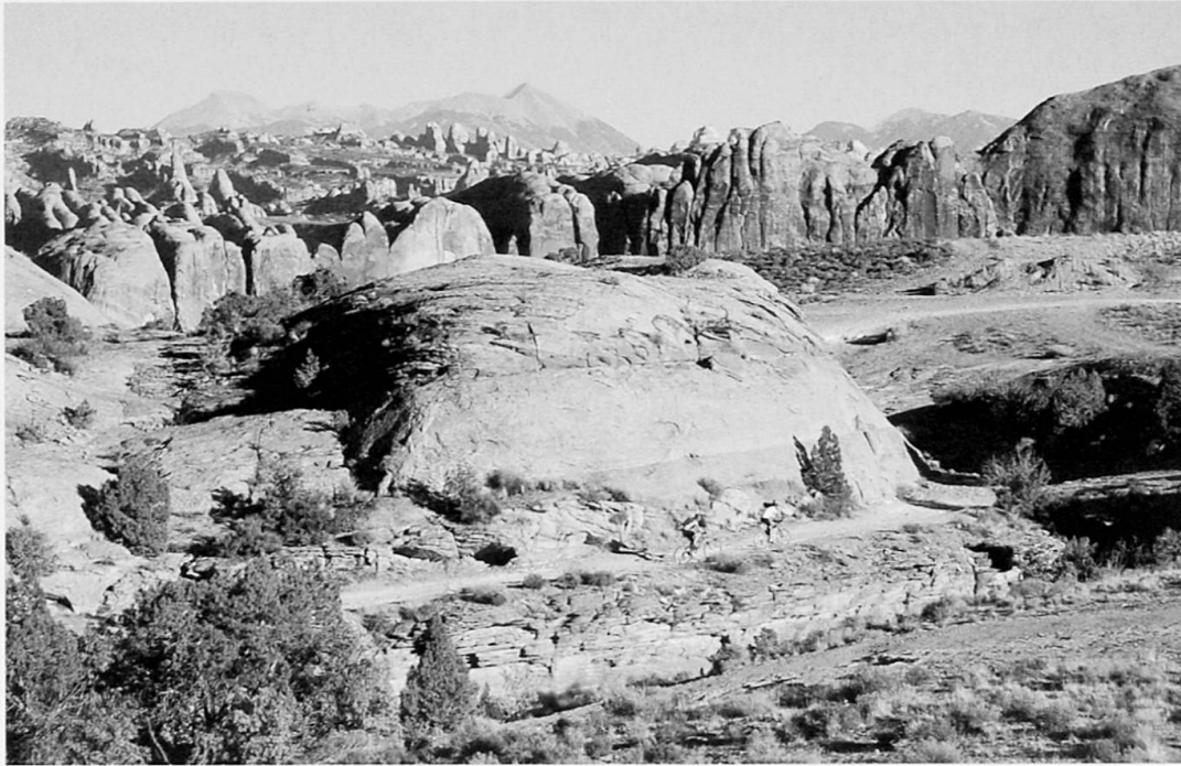
Foto 4: Zwei Mountainbiker auf dem Poison Spider Trail in der Nähe von Moab, Utah, mit Blick auf das Schutzgebiet Behind the Rocks, im Hintergrund die La Sal Mountains.

Two mountain bikers on Poison Spider Trail near Moab, Utah, viewing the wilderness area of Behind the Rocks and the La Sal Mountains.