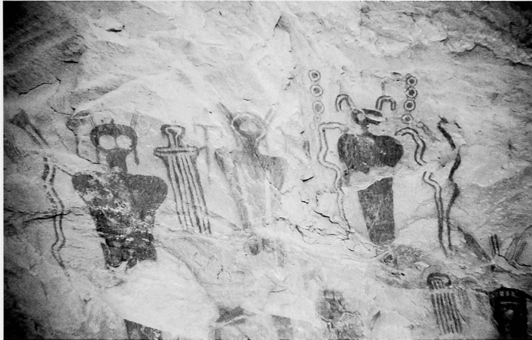
Foto 3: Piktogramme im Barrier Canyon-Stil in Thompson Wash, Grand County, Utah. Die «geistähnlichen» Figuren gelten als schamanische Elemente.

Barrier Canyon style pictograph panel at Thompson Wash, Grand County, Utah. The «ghost-like» figures represent shamanic spiritual elements.