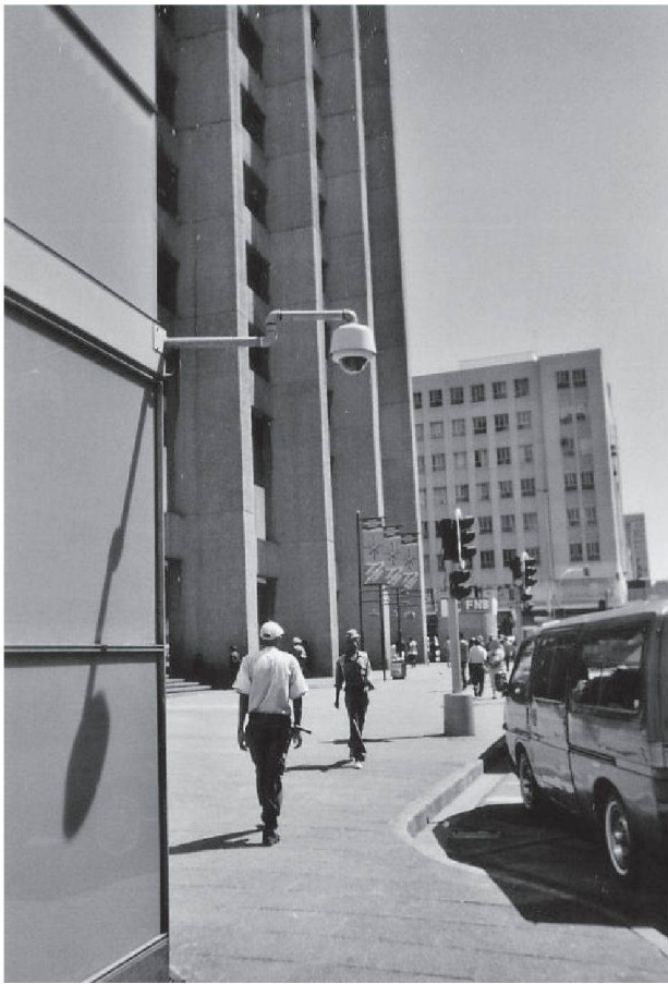
Fig. 3: Une caméra et un garde privé aux abords du Carlton Centre

Eine Kamera und ein privater Wachmann in der unmittelbaren Umgebung des Carlton Centre