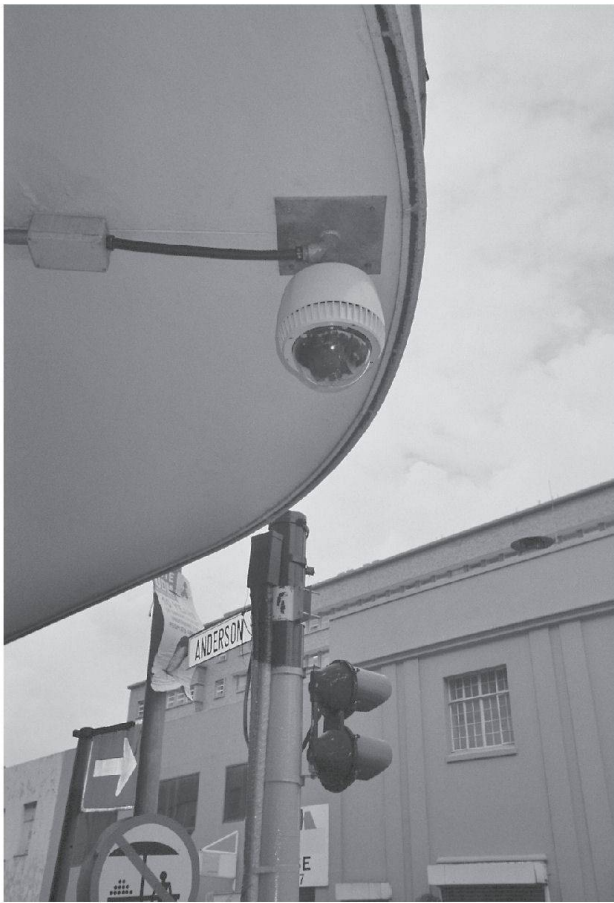
Fig. 1: Une caméra de vidéosurveillance dans le CBD Eine Videoüberwachungskamera im CBD A CCTV camera in the CBD

le point de se produire. Sur son site web, Cueincident (2004) mentionne qu'elle effectue une surveillance de type «proactif»: