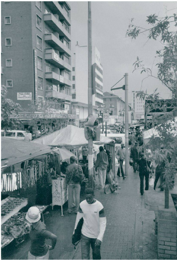
Fig. 4: Une caméra aux environs de Noord Street Eine Kamera in der Umgebung der Noord Street A camera near Noord Street Photo: L. OESCH 2004

équipements urbains obstruent le regard des caméras. D'après lui, les «criminels» ont aussi développé des nouvelles techniques afin d'esquiver le champ de vision des caméras pendant leurs agissements. Par ailleurs, il signale que le choix des zones vidéosurveillées dans le CBD n'est pas forcément le plus adéquat par rapport à la criminalité: