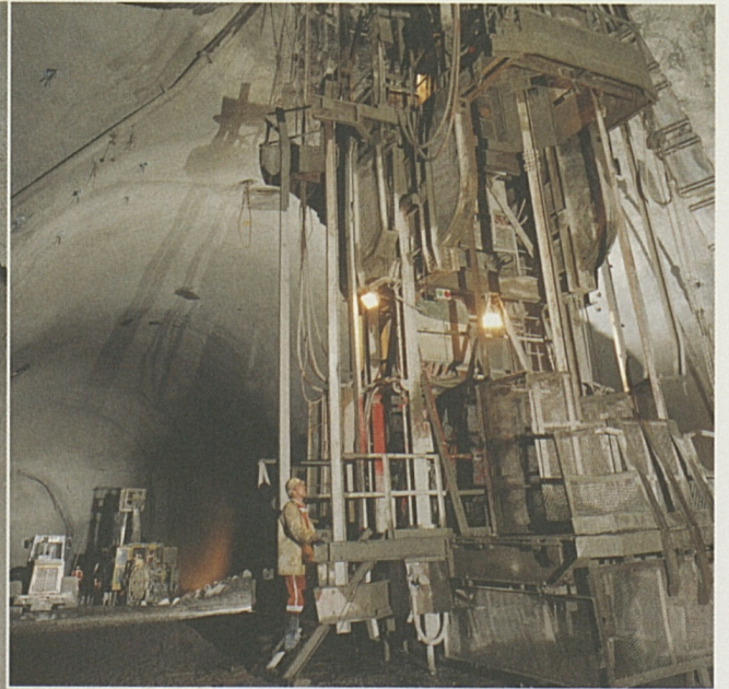
Anspruchsvolle Technik und die Arbeit unter Tag erfordern von den Mineuren Höchstleistungen.