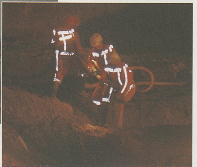
Im August 2000 haben die Ausbrucharbeiten für die riesigen Längs- und Querkavernen begonnen. Noch im Sommer 2001 werden diese Arbeiten abgeschlossen.