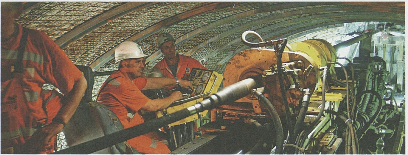
Letzte Sondierbohrung von der Tunnelbohrmaschine aus: Die Piora-Mulde enthält auf Tunnelniveau stabiles und trockenes Gestein.