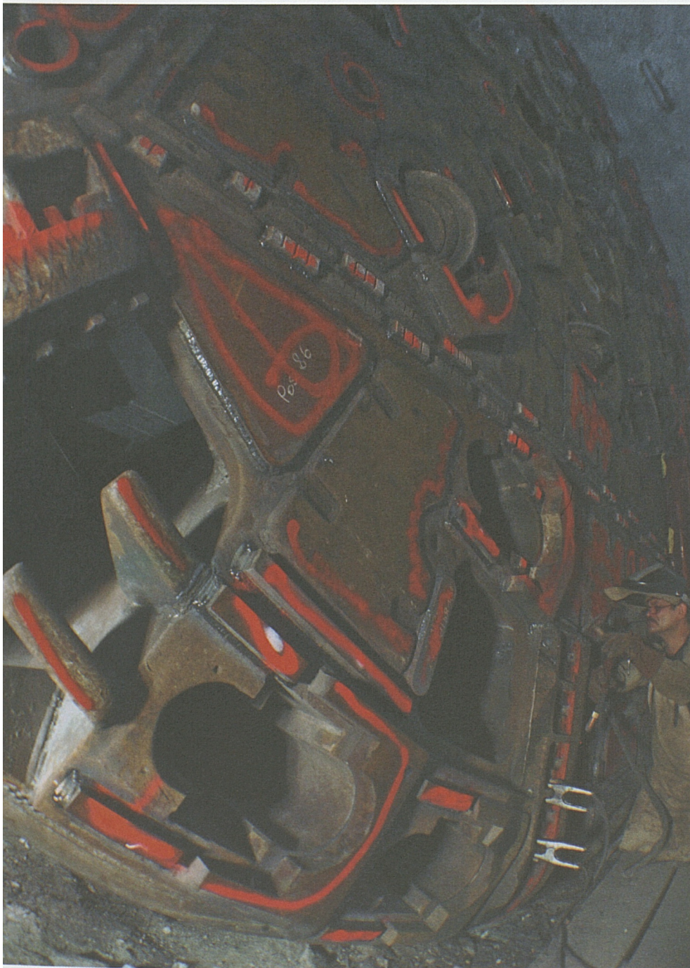
Letzte Vorbereitungen für eine schwierige Reise: Der Bohrkopf wird vor der Piora-Mulde sorgfältig revidiert.