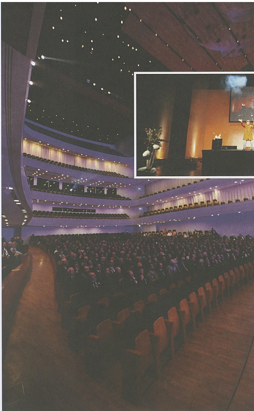
500 Projektbeteiligte erleben den Durchschlag im KKL Luzern.