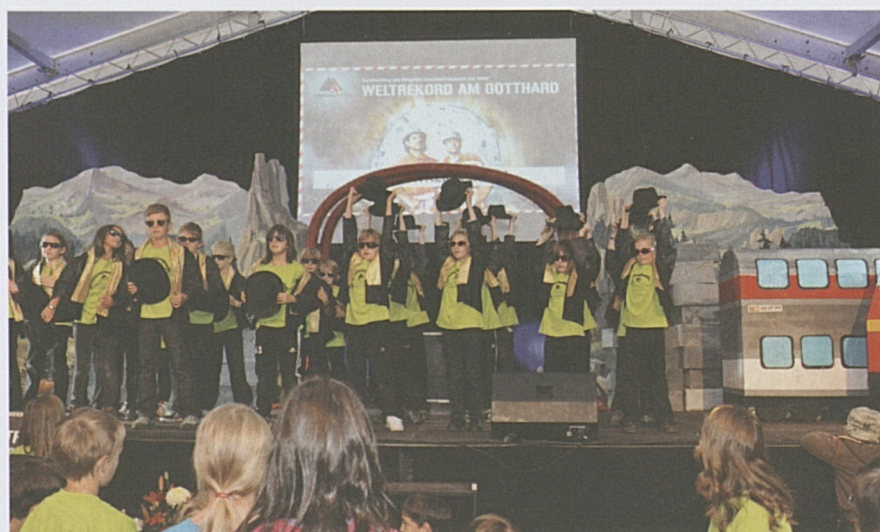
Die Primarschüler aus Tujetsch zeigen den Hauptdurchschlag am Fest für die Bevölkerung auf der Bühne.

men der Tunnelbohrmaschine war selbst im Konzertsaal spürbar. Das Komikerduo Lapsus moderierte den Festanlass. Musikalische Einlagen der Luzerner Band Spinning Wheel, bildliche Impressionen zur Baugeschichte und Anekdoten ehemaliger Projektbeteiligter bereicherten das Programm. Die Patrouille Suisse erwies den Gästen mit besonders tiefen Überflügen über das Luzerner Seebecken die Ehre. Natürlich fehlte auch die Formation Tunnel nicht. Franz Hohler begeisterte mit einer Lesung, in der er sich an seine Begegnung mit der Tunnelbrust erinnerte. Beim Apéro und beim anschliessenden «Tunneldinner» stiessen die Gäste mit einem Glas Tessiner Merlot auf den geglückten Meilenstein an.