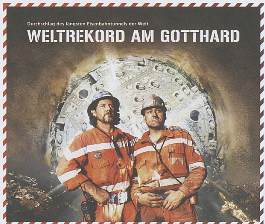
Die Helden vom Gotthard.

Rund 500 Projektbeteiligte verfolgten im feierlich beleuchteten Konzertsaal des KKL Luzern den Hauptdurchschlag auf Grossleinwand. Das Grollen und Brum-