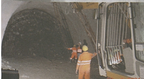
Avanzamento nella tratta in materiale sciolto.

Lo scavo della galleria di base del San Gottardo ha già raggiunto un primo piccolo ma simbolico traguardo: i due portali di Erstfeld e Bodio sono ora più vicini. A fine agosto, operai e maestranze presenti sul cantiere hanno infatti festeggiato il primo chilometro di galleria, scavato dal consorzio del lotto 552 (capitanato dalla Batigroup SA, e formato anche dalle imprese Frutiger SA e Bilfinger & Berger SA).