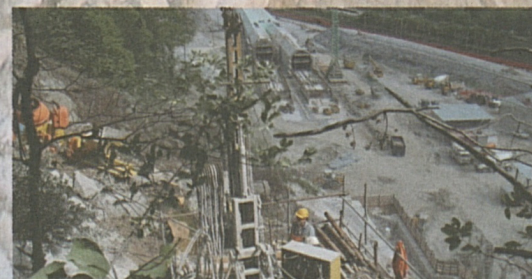
Vista sui due tubi della galleria artificiale e sul rilevato per lo spostamento della strada cantonale (a destra nella foto).

Nei prossimi mesi sarà spostata sulla galleria artificiale anche la linea ferroviaria esistente.