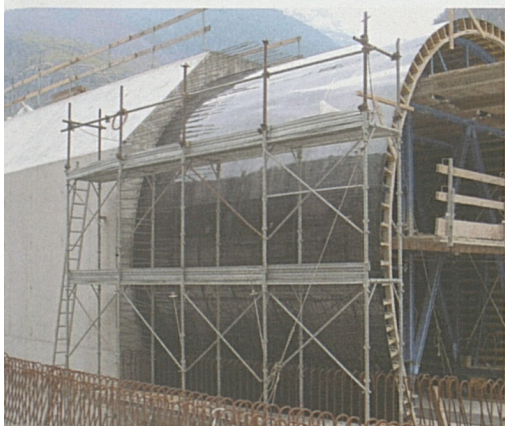
Sopra e a destra: particolari della galleria artificiale.

Alla fine del mese di agosto 2001 è stato festeggiato il primo chilometro d'avanzamento nella galleria di base del San Gottardo. L'asse del tunnel più lungo al mondo è pure stato attaccato nella difficile zona di frana della Ganna di Bodio. A fine settembre 2001 il tratto di strada cantonale nella zona del cantiere è stato sopraelevato sulla galleria artificiale costruita ad hoc.