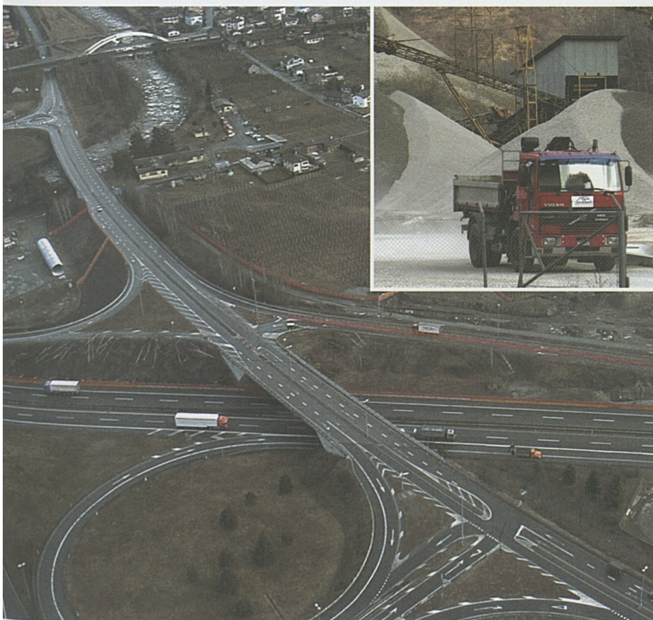
Foto in alto: La zona dello svincolo autostradale di Biasca interessata dai lavori AlpTransit.

Foto in alto a destra: Il deposito per il materiale di scavo alla Buzza di Biasca.