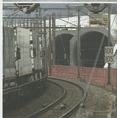
Foto sopra: La zona del portale sud della Galleria di base del San Gottardo.

Nei pressi dell'area del cantiere di Bodio-Polleigo è già stato posato il nastro trasportatore del materiale di scavo per il deposito intermedio di Pollegio che convoglierà gli inerti necessari per i terrapieni della tratta a cielo aperto. Il lotto sarà operativo entro la fine dell'estate. Il comparto di Biasca sarà responsabile anche per la sistemazione del materiale di scavo al deposito della Buzza di Biasca. Gli inerti saranno convogliati attraverso il cunicolo di trasporto di 3.2 Km, già realizzato.