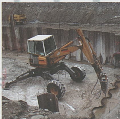
Foto in alto: I torrioni dell'edificio per la tecnica ferroviaria. Foto sopra: lavori al sottopassaggio Mondai.

Dopo aver spostato le rampe d'accesso all'autostrada, attualmente sono in corso i lavori per lo scavo della parte nord della galleria.