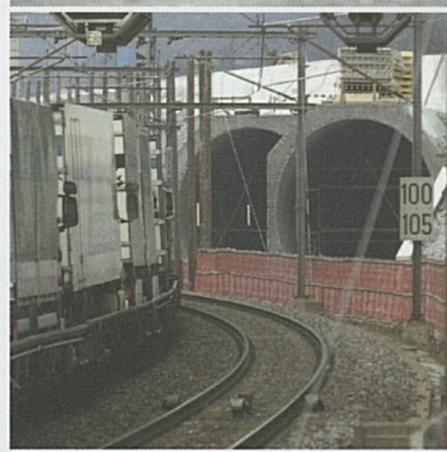
Foto sopra: La zona del portale sud della Galleria di base del San Gottardo.

Nei pressi dell'area del cantiere di Bodio-Polleigo è già stato posato il nastro trasportatore del materiale di scavo per il deposito intermedio di Pollegio che convoglierà gli inerti necessari per i terrapieni della tratta a cielo aperto. Il lotto sarà operativo entro la fine dell'estate. Il comparto di Biasca sarà responsabile anche per la sistemazione del materiale di scavo al deposito della Buzza di Biasca. Gli inerti saranno convogliati attraverso il cunicolo di trasporto di 3.2 Km, già realizzato.