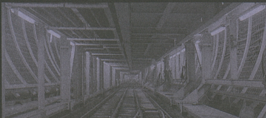
Foto pagina a fianco, dall'alto verso il basso: ecco il trenino che porta la sciolta all'esterno della galleria; al lavoro sulla fresatrice; una delle tre sciolte da record. Foto a margine: testa della fresatrice con taglianti.

Il bruco non diventerà una farfalla, ma contribuirà in modo incisivo alla metamorfosi della galleria: dalla roccia viva, alla posa del cassero, passando per i drenaggi e l'isolazione della volta, per giungere così al rivestimento finale della galleria.