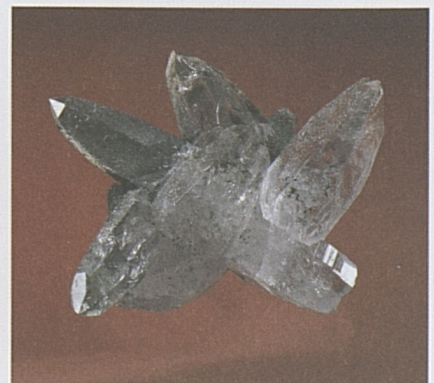
Foto sotto: piccolo gruppo di quarzi ritrovato sui cantieri ticinesi.