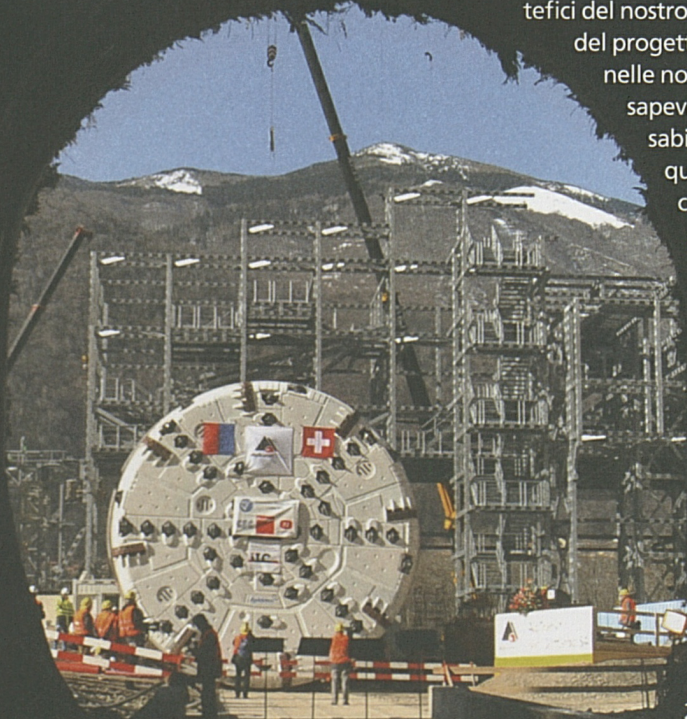
Foto: Avvio della fresa a Sigirino

Messa in esercizio della strada cantonale provvisoria spostata a Camorino