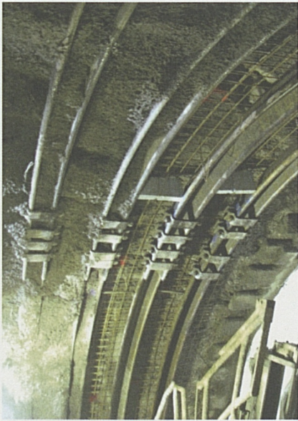
Messa in sicurezza: centine metalliche e calcestruzzo spruzzato.