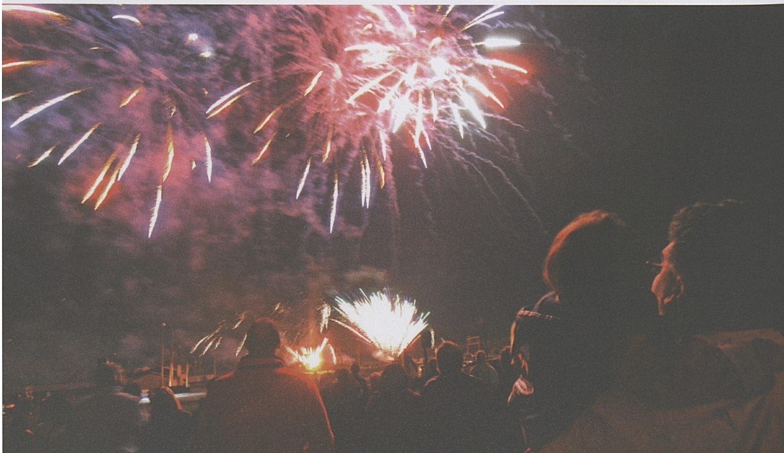
Alcuni momenti della festa a Faido.