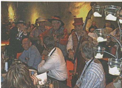
Il gruppo "Tri per Dü" in galleria a Faido.

Grazie alla diretta televisiva curata dalle emittenti svizzere (DRS e RSI), i suoni e le immagini dell'evento hanno potuto essere proposti in tempo reale all'intera popolazione e raggiungere anche i numerosi partecipanti al progetto che non hanno potuto assistervi in galleria.