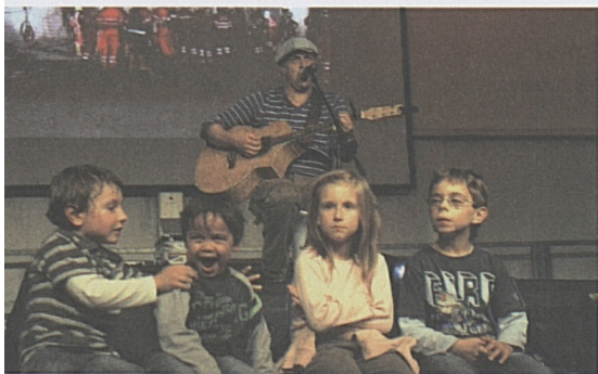
Davide van de Sfroos durante la festa a Pollegio.

Nel tardo pomeriggio e in serata sono invece arrivati gli abitanti della Leventina i quali hanno risposto con piacere all'invito da parte di AlpTransit San Gottardo SA di festeggiare questo evento. Come ospite a sorpresa era presente il gruppo Davide Van De Sfroos che ha riscaldato l'ambiente all'interno del grande tendone. Non potevano mancare i discorsi