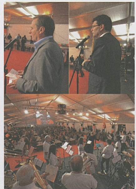
I sindaci di Polleggio e Bodio.

Soltanto 8 centimetri di sfalsamento orizzontale e 1 centimetro di sfalsamento verticale al momento della caduta del diaframma principale stanno