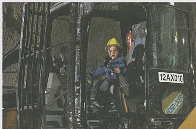
Alcuni momenti della giornata delle porte aperte.

All'esterno, approfittando di una splendida giornata di fine estate, i quasi 7'000 visitatori hanno passeggiato tra numerose postazioni informative realizzate e coordinate da AlpTransit San Gottardo SA, e dai Consorzi ITC e Condotte Cossi, vere e proprie sfilate di enormi macchine (Jumbo, caricatrici, escavatrici, mezzi di soccorso...) e suggestivi paesaggi artificiali creati dagli intricati nastri trasportatori o da montagne di materiale di scavo. Verso la fine del percorso, poco prima di accedere all'accogliente Infopoint, dove, su tutto l'arco della giornata, gli ingegneri progettisti erano a disposizione per svelare tutti i segreti del progetto, l'attenzione è stata dedicata ai visitatori più piccoli. I bambini e le fami-