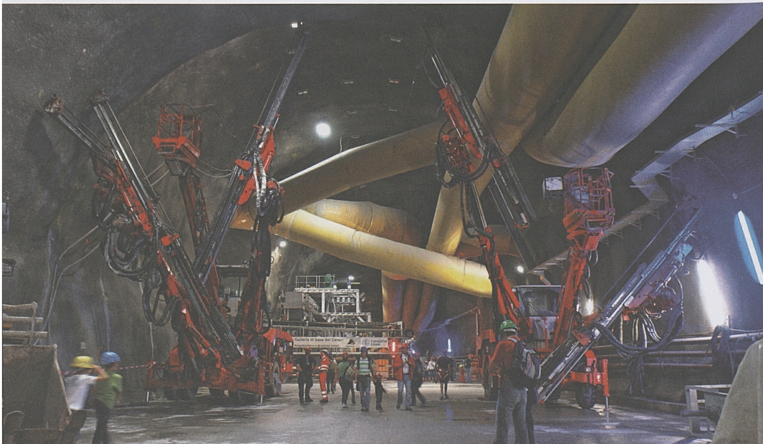
Anche i più piccoli avevano accesso alla galleria.