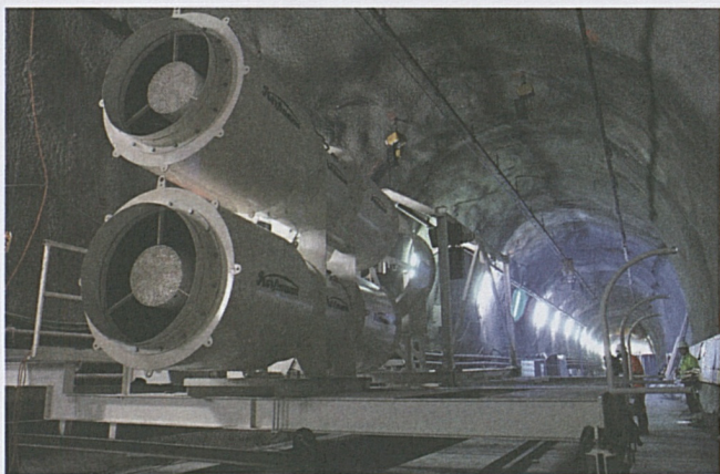
Sigirino: installazione dei tubi della ventilazione.