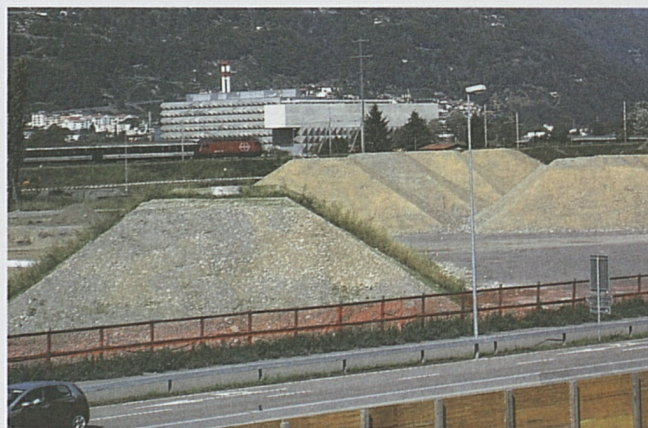
Camorino: rilevati di prearico dei futuri viadotti a nord della strada cantonale.

si i lavori del canale fugatore a sud della strada cantonale con la contemporanea apertura al traffico pubblico della nuova Via Strecce. A gennaio 2011 inizieranno i lavori per la realizzazione del viadotto Lugano-Bellinzona della lunghezza di 1 km circa, per i quali sono già stati realizzati dei rilevati di prearico piramidali in corrispondenza delle future pile.