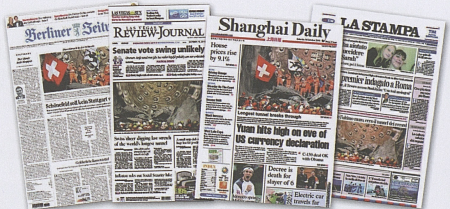
Weltweit zeigten Zeitungen auf ihren Titelseiten Fotos des Gotthard-Durchstichs – sogar der «Shanghai Daily» in China.

La galleria di base del San Gottardo, con i suoi 57 km, relega di fatto al secondo posto la galleria di Seikan di 53,9 km che collega le due isole nipponiche Hokaido e Honshu. La galleria da primato ha persino occupato le pagine della testata cinese "Shanghai Daily" che ha riportato sulla copertina le immagini della caduta del diaframma.