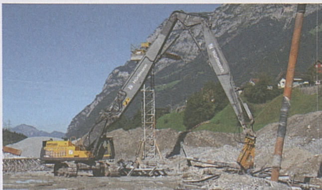
Amsteg: lavori di smontaggio.

I lavori per la rifinitura procedono a pieno ritmo e quotidianamente vengono gettati fino a 650 m 3 di calcestruzzo. A metà settembre alcune parti della stazione multifunzionale sono state consegnate alla tecnica ferroviaria. Anche all'esterno della galleria i progressi sono visibili. I nastri trasportatori per i depositi Val Bugnei e Claus Surrein sono stati smontati e per quest'ultimo i lavori di rinaturalizzazione sono conclusi.