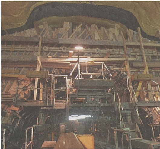
Wurm nel tubo est.

In galleria i lavori di sistemazione interna dei due tubi procedono a pieno ritmo. Il getto di calcestruzzo per la volta della galleria è in fase finale. Nel tubo est mancano ancora poco più di 100 m e il tubo ovest segue a ruota.