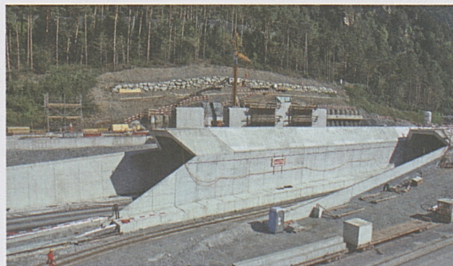
Erstfeld: galleria a cielo aperto.