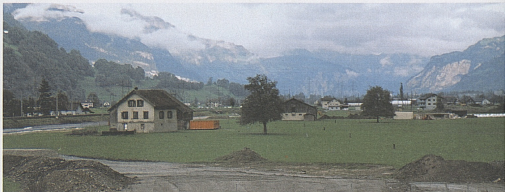
Das Besucherzentrum Erstfeld wird nördlich des A2-Autobahnzubringers erstellt.

Nördlich vom A2-Autobahnzubringer erstellt die AlpTransit Gotthard AG für die Zeit bis zur Inbetriebnahme des Gotthard-Basistunnels ein attraktives Informations- und Besucherzentrum. Auf einer Fläche von rund 400 m 2 werden sich der Kanton Uri und die ATG präsentieren. Die Ausstellung wird dem Bau des längsten Eisenbahntunnels der Welt gewidmet sein und zeigt Themen des Tunnelbaus. Der Kanton Uri hat Gelegenheit, sich innerhalb dieser Ausstellung mit einem attraktiven Auftritt zu profilieren. Ergänzend dazu können die Besucher/-innen über eine Passerelle und einen Baustellenweg die NEAT-Grossbaustelle Erstfeld zu Fuss erkunden oder in geführten Gruppen einen Informationsrundgang unter Tag absolvieren. Das Besucherzentrum in Erstfeld wird von der AlpTransit Gotthard AG erstellt und betrieben. Der Beginn der Bauarbeiten für das Besucherzentrum ist Ende 2005, die Eröffnung Mitte 2006 vorgesehen.