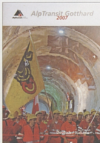
Hautnah dabei: Film AlpTransit 2007.

Murer Tunnelbau, Erstfeld Strabag AG, A-Spittal/Drau