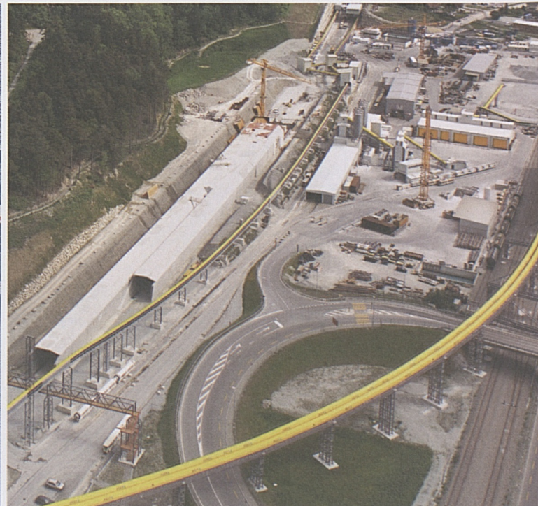
Tagbautunnel in Erstfeld.