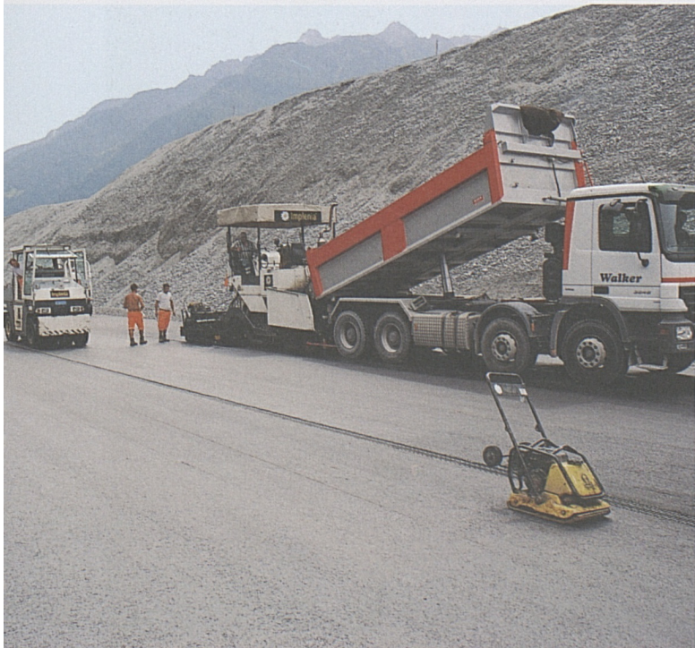
Altdorf/Rynächt: Belageinbau auf offener Strecke.

36 von 37 Querschlagsabschlusswänden sind in beiden Röhren betoniert. In der Weströhre sind die 36 Querschläge bereits mit Querschlagtüren ausgerüstet. Nach den Türen erfolgt der Einbau von Doppelboden und Querschlagslüftung. In der Oströhre im Bereich Startröhre, Montagekaverne und Speisepunkt ist das Innengewölbe eingebaut. In der Weströhre sind 97% der Bankettelemente versetzt und betoniert.