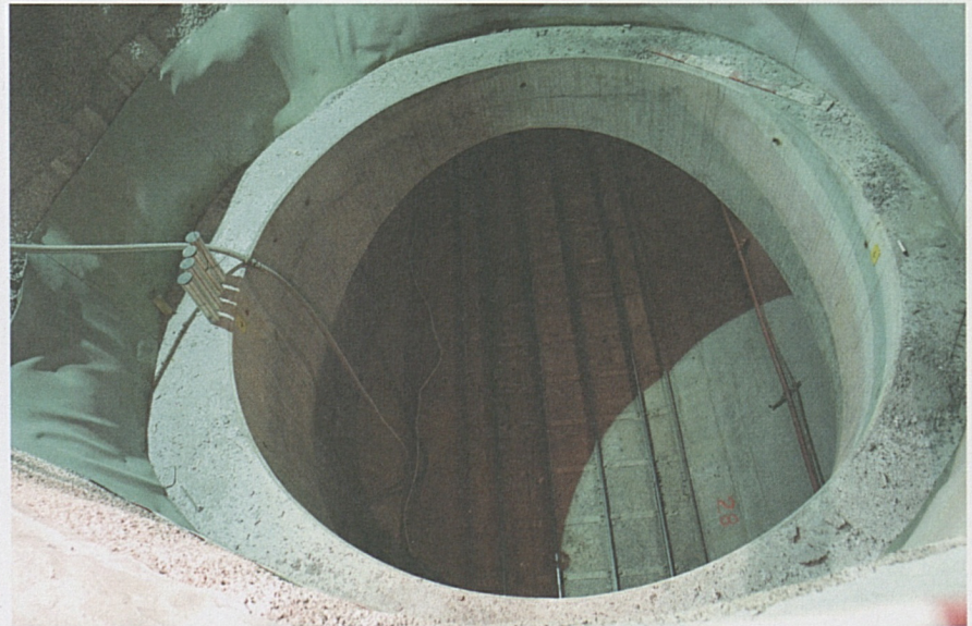
Faido: Abluftschacht mit Blick in die Weströhre.

In der Weströhre werden die Schienen der Stollenbahn rückgebaut. Die Reinigung für die Übergabe per Ende 2009 an die ATG ist im Gang. Bis jetzt wurden rund 15'000 m Tunnel gereinigt.