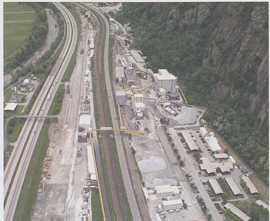
Baustelle Bodio mit Blick Richtung Norden.