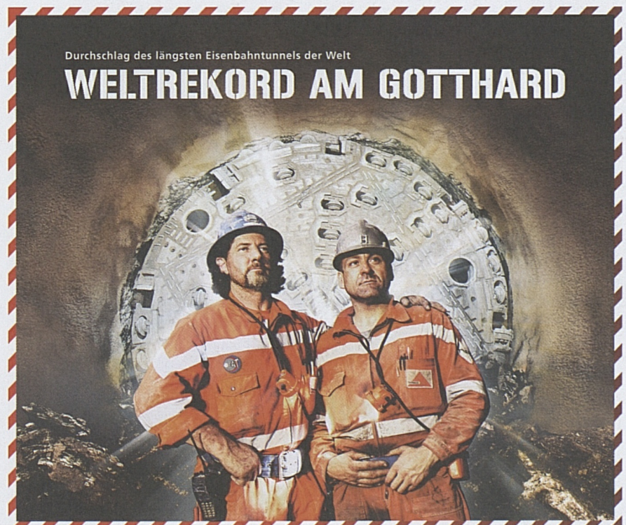
Die Helden vom Gotthard.

Rund 500 Projektbeteiligte verfolgten im feierlich beleuchteten Konzertsaal des KKL Luzern den Hauptdurchschlag auf Grossleinwand. Das Grollen und Brum-