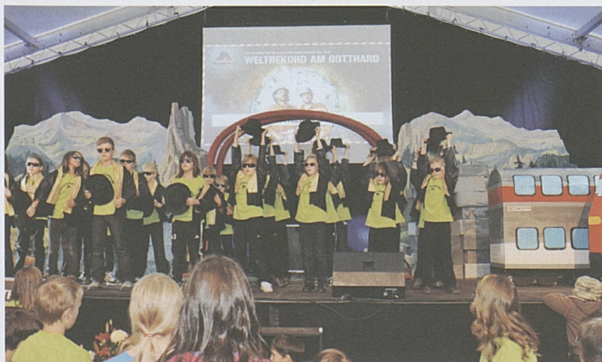
Die Primarschüler aus Tujetsch zeigen den Hauptdurchschlag am Fest für die Bevölkerung auf der Bühne.

men der Tunnelbohrmaschine war selbst im Konzertsaal spürbar. Das Komikerduo Lapsus moderierte den Festanlass. Musikalische Einlagen der Luzerner Band Spinning Wheel, bildliche Impressionen zur Baugeschichte und Anekdoten ehemaliger Projektbeteiligter bereicherten das Programm. Die Patrouille Suisse erwies den Gästen mit besonders tiefen Überflügen über das Luzerner Seebecken die Ehre. Natürlich fehlte auch die Formation Tunnel nicht. Franz Hohler begeisterte mit einer Lesung, in der er sich an seine Begegnung mit der Tunnelbrust erinnerte. Beim Apéro und beim anschließenden «Tunneldinner» stiessen die Gäste mit einem Glas Tessiner Merlot auf den geglückten Meilenstein an.