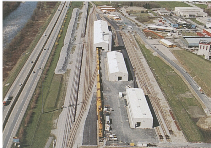
Bahntechnikinstallationsplatz in Biasca mit dem gelben Betonzug.