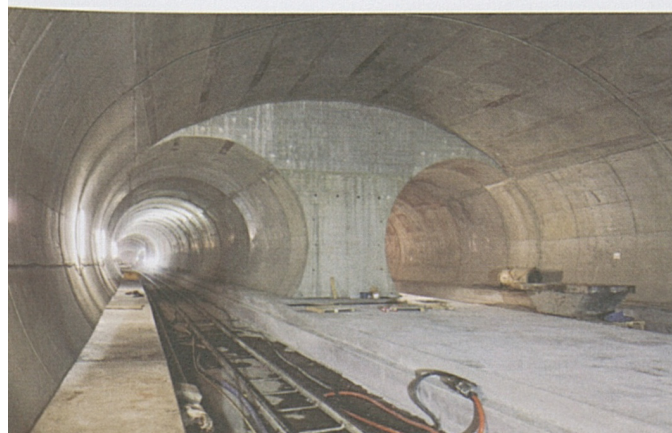
Bodio: Kabeleinzug in der Weströhre.