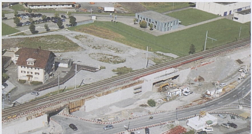
Altdorf/Rynächt: Stützmauern und Vorbereitungsarbeiten für die Unterführung Wysshus (links).

Im Abschnitt zwischen der Unterführung Wysshus und dem Schächenbach sind die Stützmauern mit Ausnahme des Bereichs Unterführung Walter Fürst fertiggestellt. Die Brückenplatten der Unterführung Wysshus (Ost) und der Bahnbrücke Gleis 100 über den Schächenbach wurden abgedichtet. Im Bereich des zukünftigen Gleises für den Einspurbetrieb ab Dezember 2011 werden die Entwässerungen im Trasseebereich erstellt. Ab der Schächenbachbrücke nach Süden erfolgte der Bau der Fahrleitungsmastfundamente.