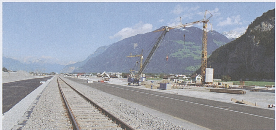
Bahntechnikinstallationsplatz Rynächt: Rohbauarbeiten für die temporären Gebäude.

Im Sommer 2010 übernahm der Bahntechnikunternehmer den Installationsplatz. Jetzt sind Werkleitungen, Kanalisation, Entwässerung sowie die Fundationen für die Betriebsgebäude im Bau.