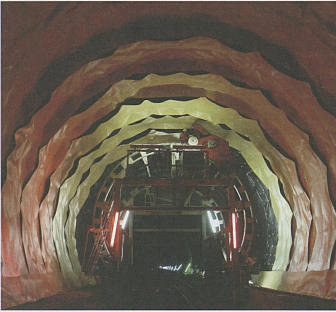
Der Innenausbau in Erstfeld hat begonnen: In der Oströhre werden die Abdichtungsfolien eingebracht.