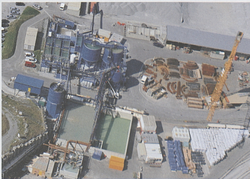
Die Wasserbehandlungsanlage musste aufgrund der grossen Mengen an Bergwasser erweitert werden.

Wie sich bereits im vergangenen Jahr gezeigt hat, ist der Bergwasseranfall im Teilabschnitt Erstfeld wesentlich höher als prognostiziert. Die anfallenden Bergwassermengen nahmen seit dem Erreichen des Spitzenwertes von rund 465 l/s im Juli 2009 wieder deutlich ab. Im Winterhalbjahr flossen rund 220 l/s aus dem Tunnel. Im Frühjahr/Sommer 2010 ist mit der Schneeschmelze mit einem erneuten Anstieg zu rechnen. Um die zu erwarten-