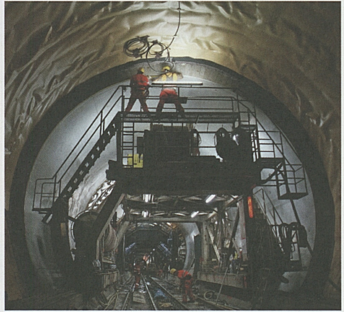
Das rund 30 cm dicke Innengewölbe ist betoniert.