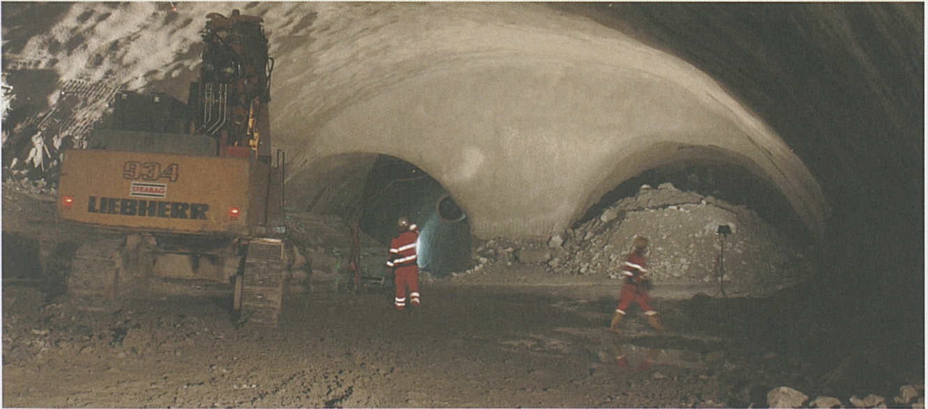
Das im Bau befindliche Verzweigungsbauwerk in der Oströhre bei Erstfeld. Links die Einspurröhre, rechts die abzweigende Röhre.

den grossen Wassermengen im Sommer 2010 bewältigen zu können, wurde die Wasserbehandlungsanlage erweitert. Es steht eine Kapazität von 400 l/s zur Verfügung, zusätzlich können 100 l/s über eine Notbehandlung geführt werden.