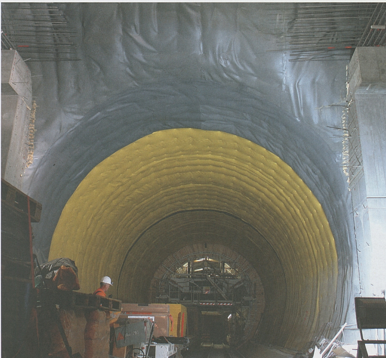
Beim Rohbau des Gotthard-Basistunnels werden Tornischen gebaut, in denen später die Spurwechsellöre Platz finden.

Jeder Querschlag erhält einen Doppelboden. Im Hohlraum, der zwischen dem Betonboden und den abnehmbaren Bodenplatten entsteht, können Kabel verlegt werden, welche die bahntechnischen Anlagen speisen.