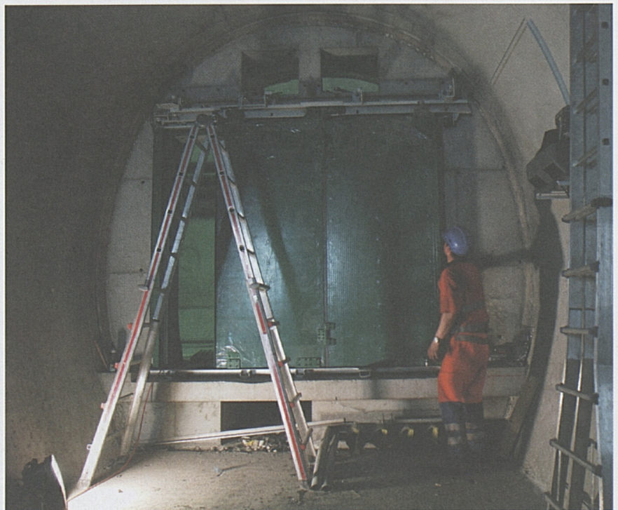
Einbau der Querschlagstüren: Im Teilabschnitt Amsteg sind bereits sämtliche Querschläge fertiggestellt. Im Teilabschnitt Erstfeld beginnt die Ausrüstung im Verlaufe dieses Jahres.