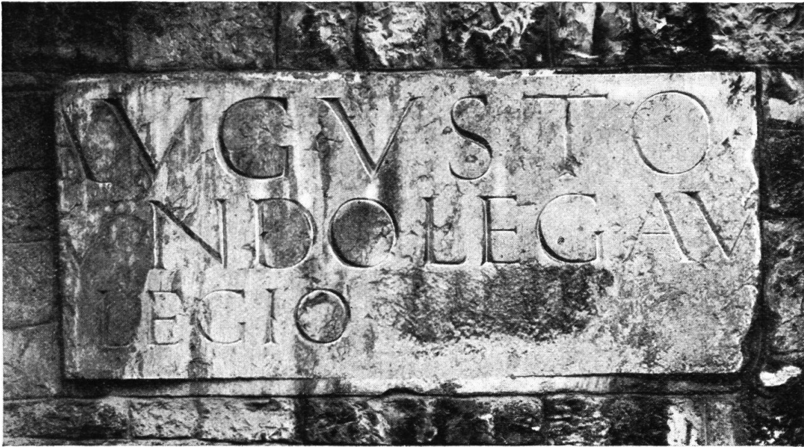
Abb. 2. Inscription aus Vindonissa,

eingemauert an der Nordostecke des Gewerbemuseums in Aarau; gefunden im Jahr 1842 15 cm tief unter der Oberfläche der Straße vor dem Effingerhof in Brugg. „Weißer Marmor, nach beiden Seiten unvollständig; Länge 183 cm, Höhe 79 cm; Buchstabenhöhe 22—15 cm.“ A. Geßner. Siehe S. 4 dieses Berichtes.