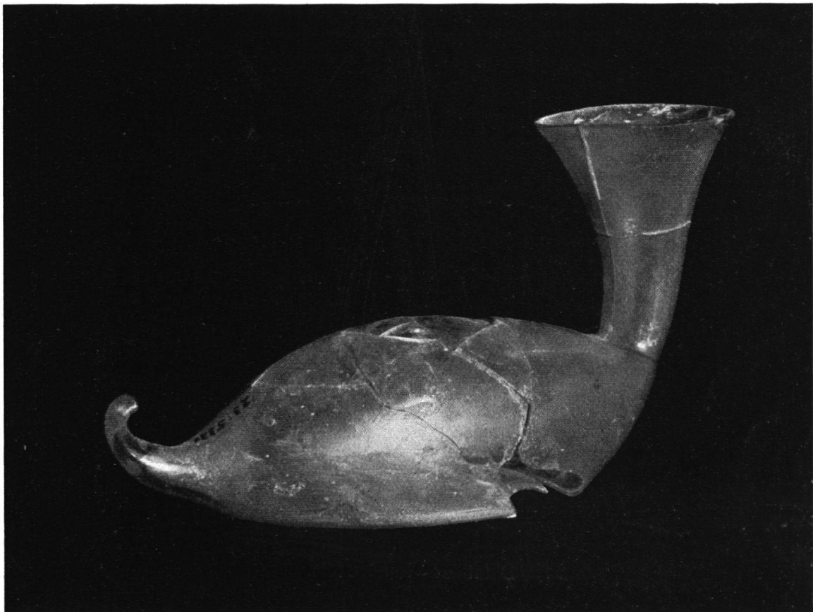
Glasgefäß mit trompetenförmiger Öffnung aus einem Brandgrab, gefunden am Bahnhof Brugg. Länge 14 cm. Siehe Seite 4.