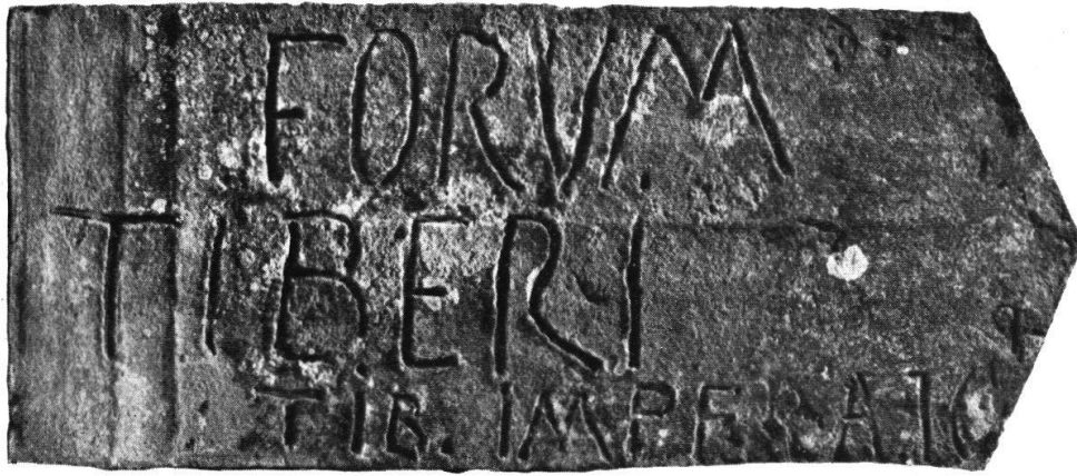
Dachziegel von Baldingen, siehe Excurs Seite 8. Länge 39,5, Breite 16,5 cm.