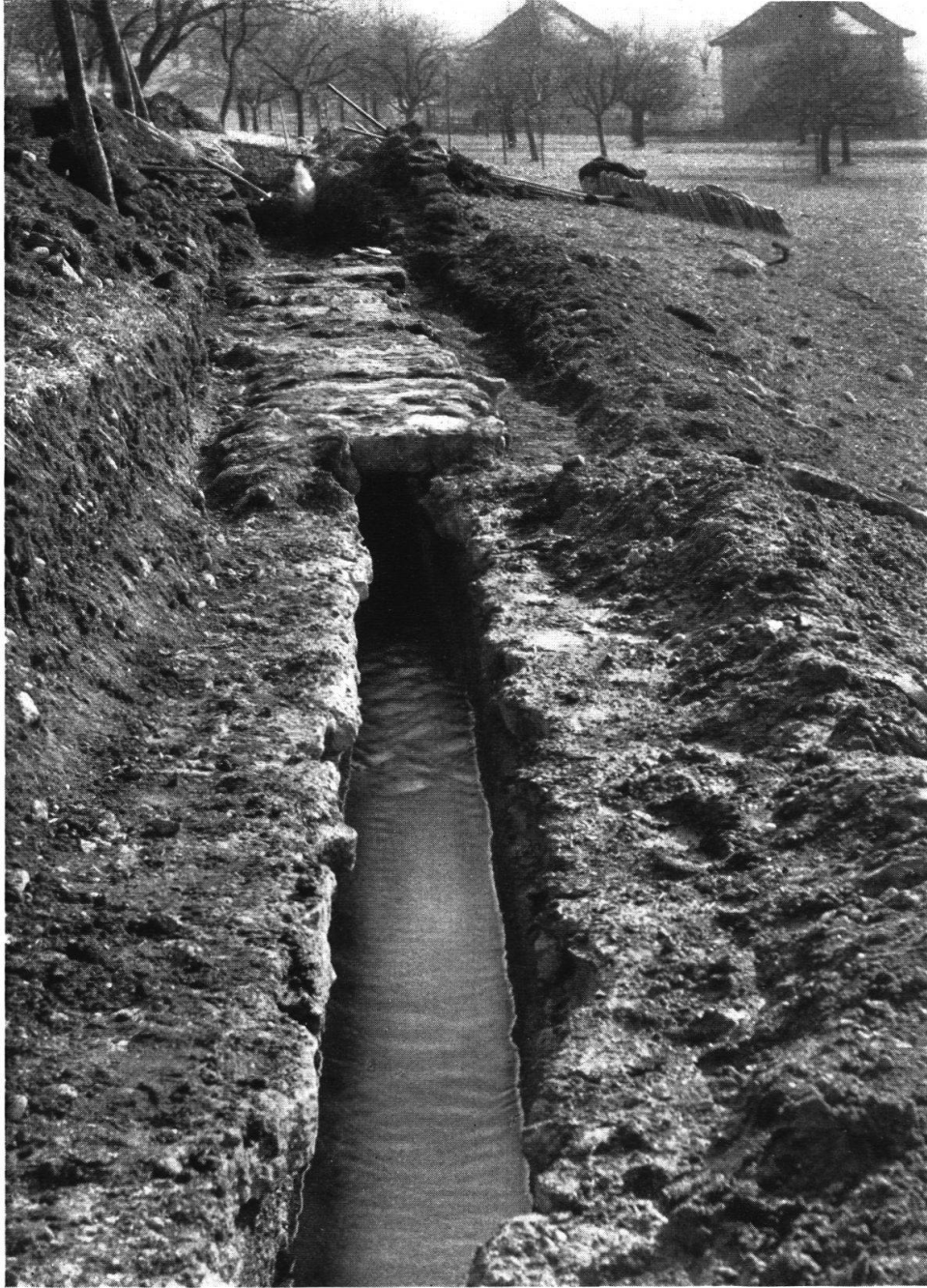
Abb. 1 Römische Wasserleitung in Oberburg