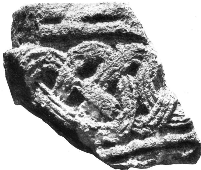
Abb. 2. Architekturstück mit frühmittelalterlichem Flechtbandornament von Altenburg.