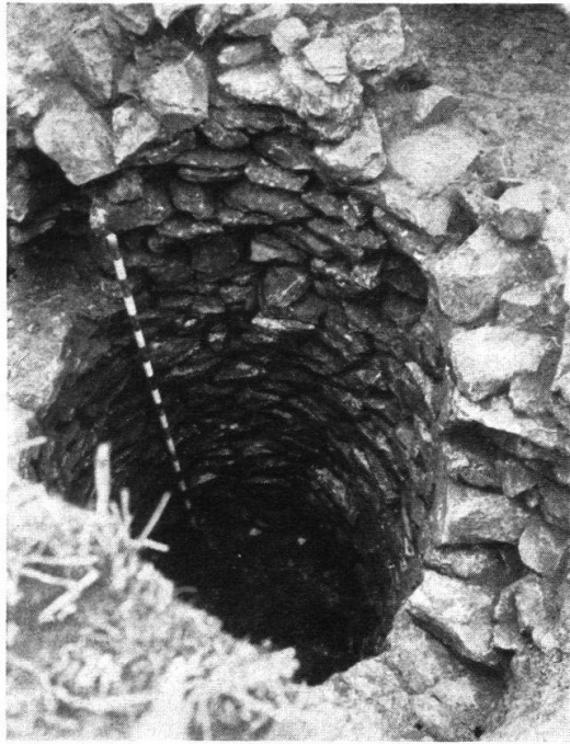
Abb. 24. Gemauerter Schacht KP 2262, Windisch (Phot. V. v. Gonzenbach).

weite zu erkennen gab. Der Schacht war 2,60 m tief in den gewachsenen Boden getrieben. Die Ausmantelung war an der höchsten Stelle noch zu einer Gesamthöhe von 2,75 m erhalten; die ursprüngliche Höhe resp. Tiefe des Schachtes läßt sich nicht bestimmen. Die Mauerung (Abb. 24) bestand aus unregelmäßig gehauenen, im ganzen radial angeordneten Kalksteinen. An den Steinen wurden keine Mörtelspuren festgestellt. Die ganze Auffüllung bestand aus dem gleichen Material wie das Umland mit vielen Scherben, Knochen usw. Die Keramik von KP 2262 umfaßt, nach freundlicher Mitteilung von Elisabeth Ettlinger, das erste und zweite Jh. n. Chr. In der Schachanlage läßt sich am ehesten ein Keller vermuten. Die vorauszusetzenden zugehörigen Gebäude wären im anstoßenden Gelände zu suchen, das nicht mehr sondiert werden konnte 1) . Doch kann an einen Zusammenhang des Schachtes mit dem in der Literatur nicht erwähnten Bau gedacht werden, der bei R. Laur-Belart, Vindonissa, Lager und Vicus, Tf. 2 in KP 820 eingetragen ist 2) .