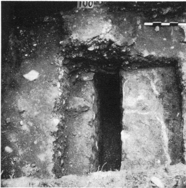
Abb. 35. Schnitt durch die Nord-Südlagerstraße entlang der Ostfront der Principia.