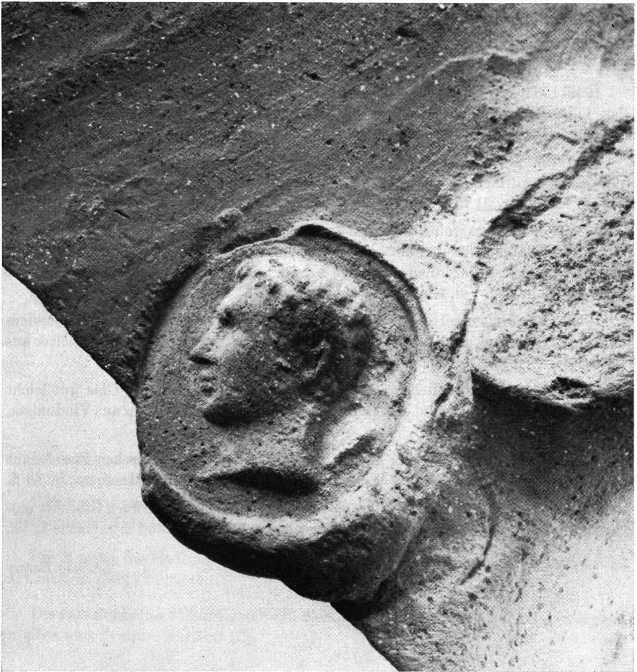
Abb. 13. Vindonissa, Siegelbild auf Amphorenscherbe, größter Dm. 29 mm.