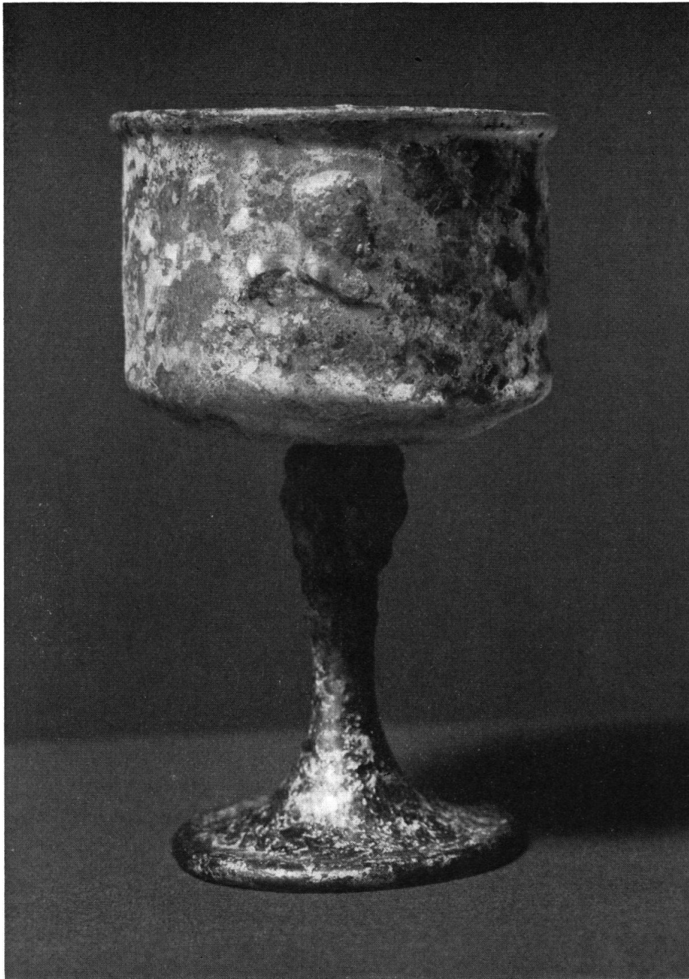
Abb. 15. Glaskelch mit Bildnis eines Philosophen. In venezianischem Privatbesitz