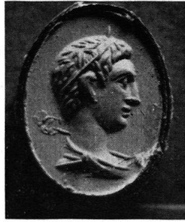
Abb. 14. Gemme aus Aquileja

gende Photographie zuzuschicken und folgende Angaben zu vermitteln: Der Abdruck mißt in der Längsachse 29 mm und befindet sich neben dem Henkelansatz einer frühkaiserzeitlichen Amphora. Er muß von einer ziemlich großen, flach geschnittenen Gemme oder einem Metallring stammen. Darauf ist der nach links gerichtete Kopf eines jugendlichen Königs zu erkennen. Daß es ein König ist, dürfte aus der dünnen Diadembinde hervorgehen, welche in dem kurzgeschnittenen Haar liegt. Auffallend ist, daß dasselbe Bildnis auf einer kleinen, ebenfalls flach geschnittenen Gemme (Abb. 14) des Museo Archeologico di Aquileia 1 wieder vorkommt. Die Umriss-