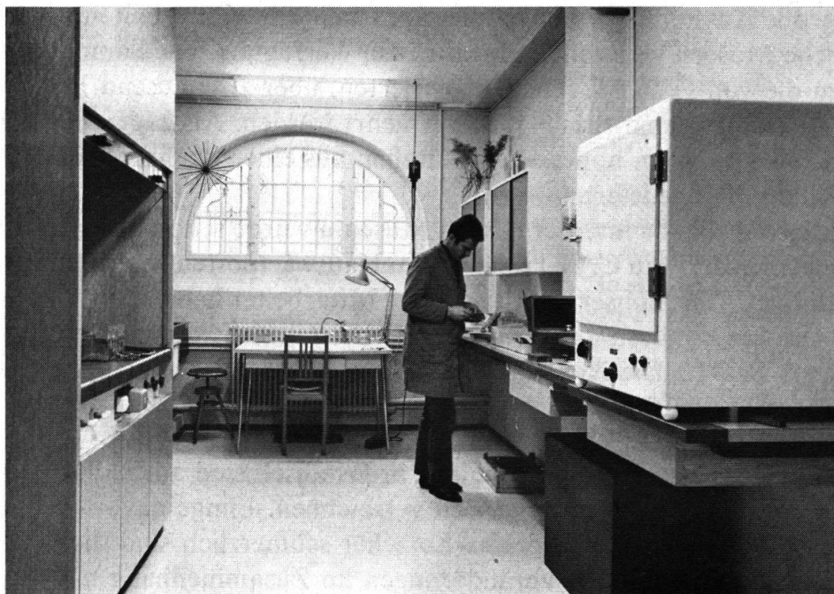
Abb. 1. Vindonissa-Museum, neue Konservierungswerkstätte im Untergeschoß. Links Laborkapelle, rechts Trockenschrank.

katalogisiert werden konnten und sich aus Platzgründen eine gewisse Auswahl aufdrängt, beschränken wir uns in der nachfolgenden Liste auf die für die Vindonissa-Forschung ergiebigsten Zeitschriften und Einzelwerke. Für die Übersendung zahlreicher Sonderdrucke aus teilweise schwer zugänglichen Publikationen danken wir den Verfassern für diesmal ohne detaillierte Angaben. Beizufügen wäre schließlich, daß der Arbeitsraum des Konservators für die Aufnahme der gesamten Bibliothek zu klein geworden ist, was bei den erschöpften Raumreserven im Museum neue Probleme aufwirft.