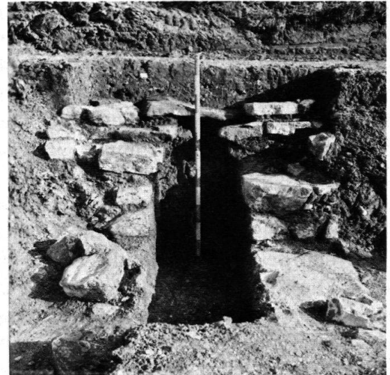
Abbildung links: Windisch. Römische Wasserleitung nach der Wiederherstellung 1968. Abbildung rechts: Hausen. Verschüttetes Teilstück einer römischen Wasserleitung.

wir uns deshalb, die Reparaturmaßnahmen selbst durchzuführen. Unter der Aufsicht von Herrn J. Lüthy betonierte unsere Arbeiterequipe abschnittsweise eine Stützmauer neben der gefährdeten Kanalstrecke, worauf die Einbruchstellen saniert werden konnten. Da in nur geringem Abstand von der Leitung ein Wohnblock errichtet wurde, war es unerlässlich, über dem undicht gewordenen Ziegelmörtelbelag der Kanalsohle einen neuen Boden aus u-förmigen Betonelementen einzubauen. Dabei ließen sich die Unregelmäßigkeiten des sehr geringen Gefälles der Leitung weitgehend ausgleichen. Hierauf wurde der Kanal mit Platten abgedeckt und ein Kontrollschacht ausgespart, um das einwandfreie Funktionieren des erneuerten Teilstückes überwachen zu können. Die Materialkosten übernahmen die Klinik Königsfelden als Eigentümerin der römischen Wasserleitung und die Gesellschaft Pro Vindonissa, wobei uns die Firma Hunziker & Cie. AG in Brugg einen größeren Rabatt gewährte. – Die Abbildung auf Seite 78 links zeigt den Kanal in geöffnetem Zustand mit der neuen Stützmauer.