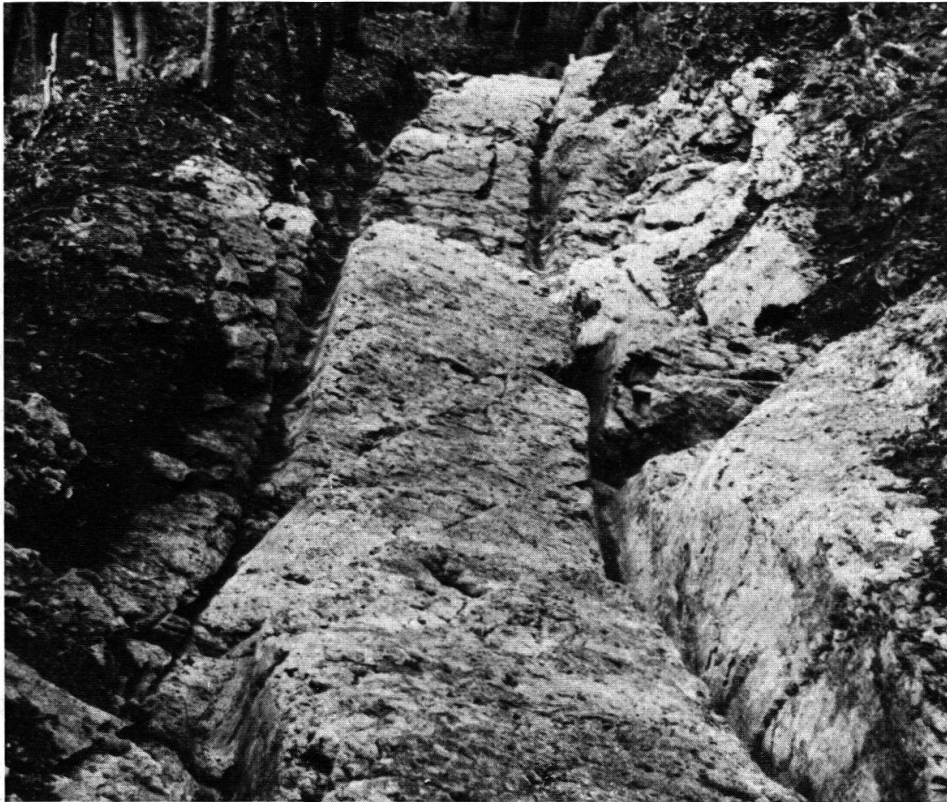
Bözberg. Römerstraße mit Wagengeleisen nach der Freilegung 1968.

Eine Ausgrabung besonderer Art fand auf Veranlassung von Herrn Prof. Dr. R. Laur an der Römerstraße auf dem Bözberg statt. Mit Hilfe von Freiwilligen aus Effingen wurde an zwei Stellen das in den felsigen Abhang eingehauene Trasse mit Karrengeleisen freigelegt. Interessanterweise stammen die datierbaren Kleinfunde, wie z. B. Reste von Hufeisen, aus nachrömischer Zeit, was auf die Benützung der Straße bis ins Mittelalter hinweist. Ein Bericht über die Untersuchungen, welche fortgesetzt werden sollen, erschien in der Zeitschrift «Ur-Schweiz» 32 (1968), S. 30ff. und 72ff.