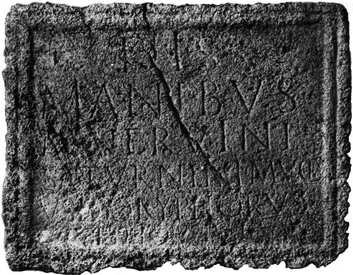
Abb. 1. Windisch, Oelackerstrasse, Grabplatte

mit demjenigen des letzten C vom rechten Rand. Auch hier kann und darf also mit einer zentrierten Zeile gerechnet werden. Das heißt, daß die erste erkennbare Haste links auch wirklich den Zeilenanfang darstellt.