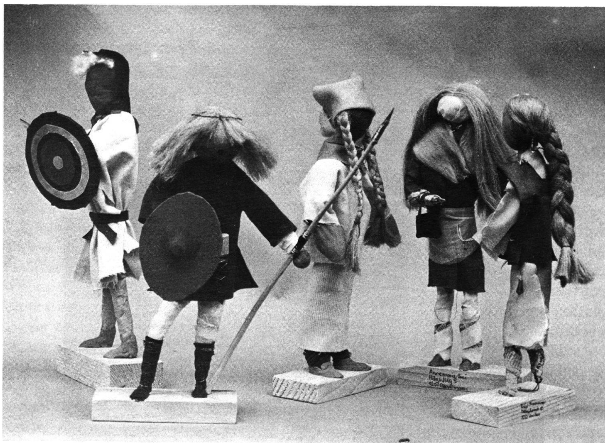
Sommerferien 1981: Figuren zum Thema «Alemannische Adlige»

Die von den Kindern geschaffenen Objekte sind relativ frei von den Anschauungen Erwachsener und besitzen daher eine eigene Ästhetik. Es handelt sich nicht um Modelle oder fachgerechte Rekonstruktionen einer historischen Gegebenheit. Dennoch wurde durch sie historischer Stoff bewältigt, indem das theoretische Wissen aktiviert und konkretisiert wurde. Die Kinder lebten sich in eine bestimmte Situation ein und fanden aus ihr heraus oft technische Lösungen, wie sie für die damalige Entwicklungsstufe charakteristisch sind. Da es sich jedoch nicht um einen Nachvollzug der vergangenen Zustände handelte, blieb eine verstandesmässige, manchmal auch ironische Distanz erhalten, die es den Teilnehmern ermöglichen sollte, auch weiterhin neue Informationen zum entsprechenden Thema aufzunehmen und in ihr sich wandelndes Geschichtsbild einzufügen.