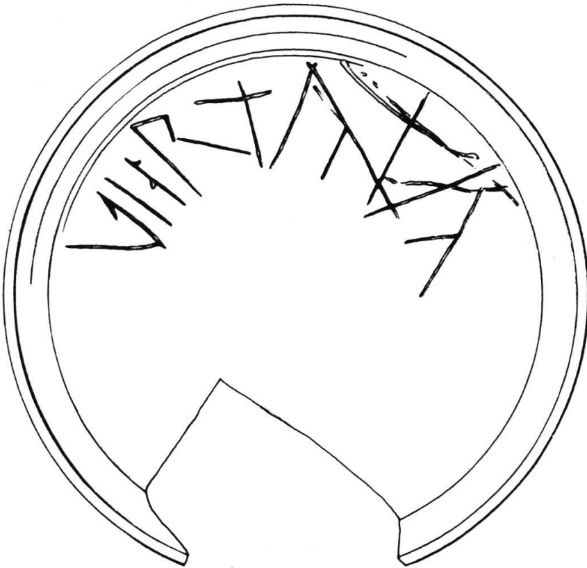
Abb. 2 Graffito 1:1.