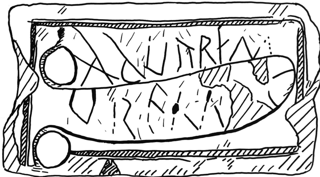
Bild 3: Zeichnung des Graffitos auf dem Windischer Phallusrelief.

seinen Abschluss wohl in den tiefen Kratzern auf dem Phallus selbst findet (Bild 3). Ganz eindeutig ist dieses Graffito nachträglich angebracht worden. Es kann folgendermassen gelesen werden: