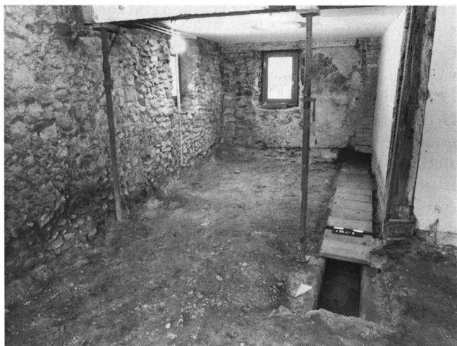
Abb. 7: Windisch-Lindhofstrasse 6 1996 (V.96.4): Das Erdgeschoss im Umbau mit dem freigelegten und mit Betonplatten neu zugedeckten römischen Wasserleitungskanal unter dem Fussboden.

selbst blieb unangetastet. Er wurde anschliessend mit modernen Betonplatten wieder zugedeckt und nach einer Trennschicht und Trennfuge mit dem neuen Zimmerboden überbaut.