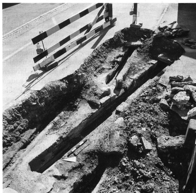
Abb. 9: Windisch-Lindhofstrasse 1996 (V.96.5): Blick aus Westen auf die Lindhofstrasse vor dem Haus Strebel (Lindhofstrasse 6): Der aufgedeckte römische Wasserleitungskanal führt von oben rechts nach unten links; im Zentrum mündet in die römische Wasserleitung von oben ein kleiner Kanal, der wohl das Auslaufwasser des ehemaligen mittelalterlichen Bärenbrunnens zurückführte.

chiatrischen Klinik Königsfelden speist und lediglich das Restwasser im römischen Kanal verbleibt und darin durch den Keller der Alterswohnungen in Windisch fliesst; dieses Restwasser fliesst noch ca. 50 m weiter im römischen Kanal und wird dann mitten in der Lindhofstrasse in die Ortskanalisation bzw. neuerdings zur Versickerung abgeleitet (s.u.). Nach längerem Ringen, das z. T. durch die Presse an die Öffentlichkeit gelangte, konnte zusammen mit den Gemeindebehörden ein Kompromiss gefunden werden: Der wasserführende Abschnitt und der gut erhaltene Teil des römischen Wasserleitungskanals in der