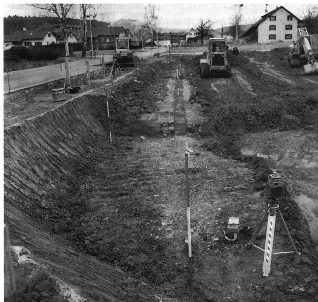
Abb. 10: Hausen-Stückstrasse 1996 (Hus. 96.1 und 2): Die begonnene Baugrube aus Süden; im Vordergrund der abgebrochene Teil des römischen Wasserleitungskanals.

Diese Fundstelle liegt rund 2,5 km südlich weit ausserhalb des Legionslagers. Hier wurde beim Aushub für den Neubau des Mehrfamilienhauses Stückstrasse 11 der sog. «ältere» römische Wasserleitungskanal, der schon lange verstopft und wiederholt unterbrochen ist, auf einer Länge von rund 50 m angetroffen (JberGPV 1990, 43 ff.). Leider erfolgte keine Fundmeldung, und bei unserer Kenntnisnahme wa-