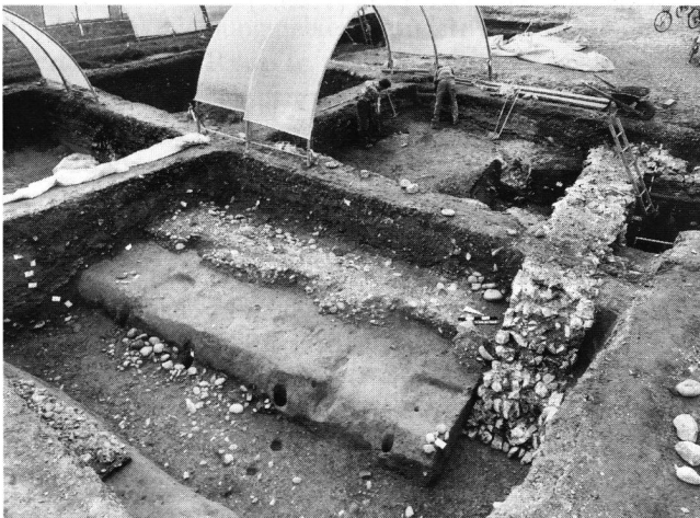
Abb. 3: Windisch-Breite 1996 (V.96.8): Blick aus Nordosten ins Ausgrabungsfeld 11 bei fortgeschrittenem Grabungsstand: Rechts das hofseitige Mauerfundament der Kammerreihe an der Nordseite der Principia der 11. Legion; diagonal von links oben nach rechts unten im Vordergrund ein Abwassergraben der frühen Holzbauphase (13. Legion), der von einer Reihe Pfostennegativen in regelmässigen Abständen flankiert ist, und der links und rechts von einer gekiesten Fläche begleitet wird. Es dürfte sich um eine Strasse handeln, in deren Mitte der mit starken, tragfähigen Holzbohlen zugedekte Abwasserkanal verlief.