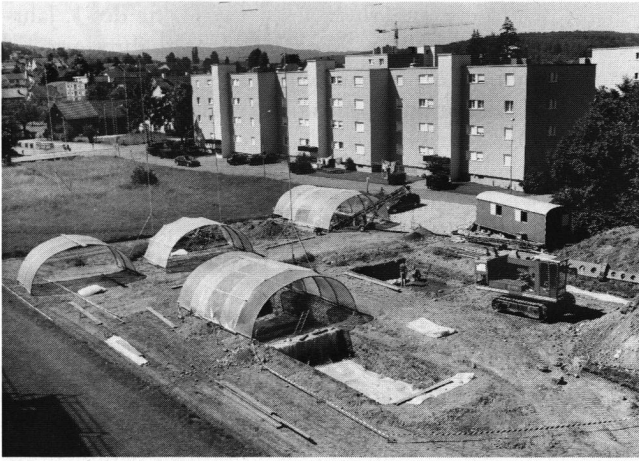
Abb. 2: Windisch-Breite 1996 (V.96.8): Die Situation des Ausgrabungsplatzes aus Nordosten mit den ersten Grabungsfeldern im Vordergrund. Im Hintergrund die Überbauung Wartmann auf dem ehemaligen Areal Spillmann und Dätwiler von 1972/73 bzw. ca. 1980/81; im Hintergrund links die Dorfstrasse, die das Ausgrabungsareal gegen Süden begrenzt.