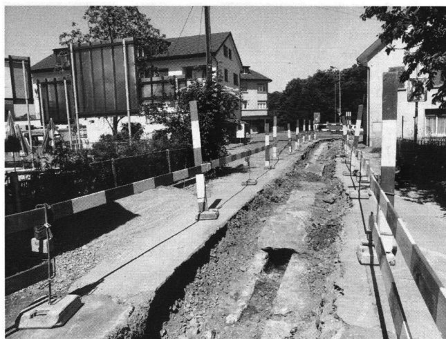
Abb. 8: Windisch-Lindhofstrasse 1996 (V.96.5): Blick aus Süden auf die Lindhofstrasse in Richtung Zürcherstrasse. Direkt unter dem Strassenbelag liegt der römische Wasserleitungskanal, der in den letzten Jahrzehnten stellenweise unterbrochen wurde.

Das Wasser aus dem römischen Frischwasserkanal wird in der Brunnenstube bei Oberburg so verteilt, dass eine fest bestimmte Wassermenge über eine neuzeitliche Rohrleitung den Springbrunnen vor dem Hauptgebäude der Psy-