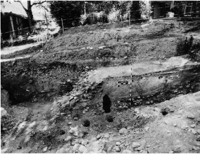
Abb. 6: Windisch-Ländestrasse 1996 (V.96.7): Situation und Übersicht auf die Grabungsfläche mit gestuftem Profil aus Osten: Die Reuss verläuft ausserhalb des linken Bildrandes; in der Bildmitte sind in der Fläche sowie im Profil Pfostennegative der Uferverbauung zu erkennen, links davon und darüber die Geröllpackung im Böschungsbereich und die Hinterfüllung von Schwemmsand.

überbauten Siedlungsgebiet, sondern im eigentlichen Uferbereich der Reuss in römischer Zeit. Sie enthielt die Reste einer starken Uferverbauung: In der Grabungsfläche von rund 50 m 2 waren ohne erkennbare Ordnung mindestens 26 Pfosten tief in den Grund geschlagen. Die Pfosten waren z. T. mit eisernen Pfahlschuhen bewehrt und hatten einen Durchmesser bis zu 40 cm. Im Bereich der Pfähle lag stellenweise noch eine bis zu 1,6 m hohe Geröllpackung, die ihrerseits mit einer Mischung von Geröll, Schwemmsand sowie römischem Bauschutt mit Siedlungsabfällen aus der 2. Hälfte des 1. Jahrhunderts hinterfüllt war. – Südlich vor der Uferverbauung fanden sich noch eine Grube mit Fundmaterial aus dem 1. Jahrhundert und eine mit spätantiken Münzen und Lavezfragmenten.