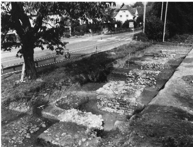
Abb. 5: Windisch-Dohlenzelgstrasse 1996 (V.96.2): Die Reihe der Fundamentklötze aus Südosten; im Hintergrund die Hauserstrasse.

weit über den römischen Marktplatz hinaus und biegt mit den letzten, südlichen Fundamenten in östlicher Richtung gegen die Anhöhe von Oberburg hin ab. Die Frage von Wiedemer 1963 «Reste einer Wasserleitung?» bzw. «vermuteter Aquädukt» (JberGPV 1967, 99) darf und muss aufrecht erhalten bleiben: Die Möglichkeit, dass es sich hier um die Fundamente für Pfeiler eines Aquäduktes handelt, bleibt unwidersprochen; dagegen blieben weitere Indizien wie z.B. grosse Terrazzo-Brocken für eine Kanalauskleidung oder eindeutige Bauteile für Kanalabdeckung oder Bogenkonstruktionen aus. Als eindeutiger Beweis für einen Aquädukt ist unter diesen Umständen fast nur noch der kontinuierliche Übergang der Fundamentreihe direkt in eine der römischen Wasserleitungen denkbar.