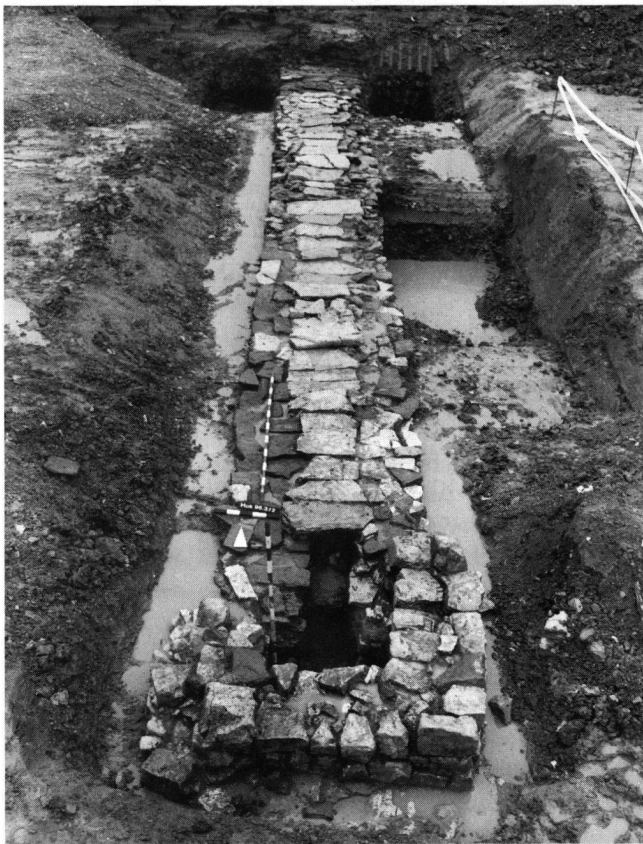
Abb. 12: Hausen-Stückstrasse 1996 (Hus. 96.3): Der Leitungsverlauf aus Süden: im Vordergrund der freigelegte Einstiegschacht.

Ebenfalls an der Stückstrasse (Nr. 23) in Hausen, jedoch 150 m südlich der oben angeführten Fundstelle Stückstrasse 11, wurde der Kantonsarchäologie für Herbst 1996 der Neubau eines weiteren Mehrfamilienhauses angekündigt. Aufgrund unserer Kenntnisse war zu erwarten, dass am Rand der Parzelle die sog. «ältere» römische Wasserleitung durch die Baugrube tangiert würde (JberGPV 1990, 43 ff.). Deshalb wurde unmittelbar vor Aushubbeginn der tote römische Wasserleitungskanal durch einen gezielten Sonderschnitt lokalisiert und anschliessend archäologisch untersucht. Die Freilegung geschah hier besonders sorgfältig, da seitens der Gemeinde Windisch geplant war, ein längeres Teilstück davon als Ganzes an die Lindhofstrasse in Windisch zu transportieren, zu konservieren und als Denk-