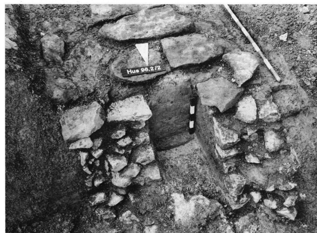
Abb. 11: Hausen-Stückstrasse 1996 (Hus. 96.1 und 2): Schrägaufsicht aus Norden auf den freigelegten römischen Wasserleitungskanal in der südlichen Baugrubenböschung.

ren bereits rund 10 Laufmeter des unübersehbaren römischen Bauwerks zerstört und abgetragen, weshalb wir auf dem Bezirksamt eine Anzeige mit unerfreulichen Bussenfolgen erstatteten.