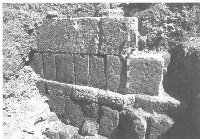
Abb. 3: Oescus. Neu entdeckter Teil der Stein-Erde-Umwehrungsmauer in Schalenteknik aus flavischer Zeit.

Die Fünfte Makedonische Legion wurde im Jahre 101 von Oescus abgezogen und nahm am Ersten Dakischen Krieg teil; danach wurde sie nach Troesmis in Norddobrudja (im heutigen Rumänien nahe der Mündung der Donau) verlegt. Von Vindonissa aus wird an ihre Stelle die legio XI Claudia nach Oescus versetzt 35 , die dort zwischen 101 und 104 lagerte. Aus dieser Zeit findet man sehr viele Ziegelstempel 36 (Abb. 2). Die Legion blieb in Oescus bis zum Ende des Krieges und liess sich danach in Durostorum (heute: Silistra [гр. Силистра, България] Bulgarien) am rechten Donauufer nieder. Die legio XI Claudia blieb in Durostorum bis zum Ende der Antike und hinterliess zahlreiche Inschriften und archäologische Funde. In Novae dagegen blieb die legio I Italica . Was die in Obermoesien einquartierten Legionen betrifft, so ist die legio IV Flavia von 89 bis 101 n. Chr. in Singidunum belegt, die legio VII Claudia in Viminacium. Im gesamten Zeitraum der frühen Kaiserzeit war auch ein bedeutender Teil an Auxiliartruppen in Moesien einquartiert. Die erste Truppe, die aus schriftlichen Quellen und epigraphischen Denkmälern bekannt ist, ist die cohors I Sugambrorum mit Kastell in Montana (гр. МОНТАНА) im heutigen Nordwestbulgarien. Tacitus erwähnt, dass diese Kohorte gemeinsam mit einer der moesischen Legionen den Aufstand der Thraker südlich von Gebirge Haemus im Jahre 26/27 n. Chr. unterdrückt habe 37 . Vor einigen Jahren wurde entdeckt, dass bereits in der spätauguste-