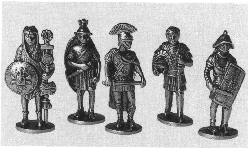
Zinnlegionäre: Fr. 1.50 bis 8.–