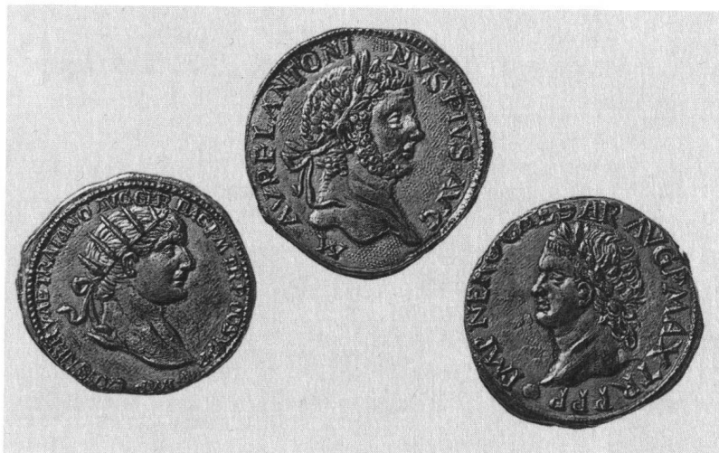
Münzen: Fr. 2.– bis 12.–