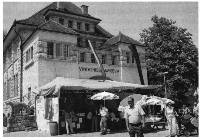
Abb. 2: Die Taberne Blasia Vertatta anlässlich des kantonalen Musikfestes in Brugg.

Ein in den letzten Jahren weniger genutztes Angebotssegment bauten Gertrud Morel und Hedi Muntwiler wieder neu aus. Sie organisierten 18 Apéros im Museum und einen auf einer Ausgrabung in Windisch. Ausserdem halfen sie beim Eröffnungsapéro für die neuen Stadtführungen in Brugg mit. Während des 6 Tage dauernden kantonalen Musikfestes in Brugg führten Viktor Schmid und Gertrud Morel zusammen mit einem Team von Museumsfreunden die von etwa 3000 zahlenden Gästen