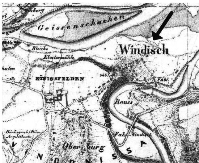
Abb. 2: Ausschnitt aus der zwischen 1837–1843 von E.H. Michaelis aufgenommenen Karte. Die Hangkante der Schotterterrasse auf welcher Unterwindisch und die Fundstelle Windisch-Dammstrasse liegen, ist gut zu sehen (Pfeil). (Staatsarchiv Aarau, Faksimile Ausgabe, Verlag Cartographica, Murten 1991).

Bereits in den 1960er-Jahren stiess man, leider ohne Meldung an die zuständige Stelle, beim Bau von Einfamilienhäusern an der Dammstrasse wiederholt auf Gräber.