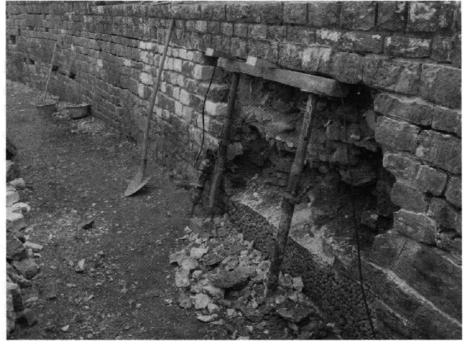
Abb. 2: Grossflächige Ablösungen der Mauerschale an der mittleren Ringmauer bedingen eine neue, zusätzliche Verankerung (Foto T+U AG).

Die Pflegemassnahmen am Baumbestand wurden im üblichen Rahmen weitergeführt. Die Gesamtanlage wird im Rahmen des Restaurierungskonzeptes im Jahr 2009/10 fertig gestellt werden. Die Tradition des «Amphi-Heuet» wurde wiederum erfolgreich durchgeführt. Die Pflege der Parkanlage durch das Ehepaar Sigrist erfolgte in gewohnter Manier professionell und Störenfriede wurden mit grosser Entschiedenheit weggewiesen. Besten Dank allen Beteiligten rund um das Amphitheater.