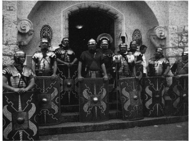
Legionäre der 11. Legion haben die letzten Besucher aus dem Museum geleitet – und bewachen das Tor bis zur Neueröffnung.

Der Dank für eine gute und erfolgreiche Zusammenarbeit geht an das Ausstellungsteam der Steinmetze,