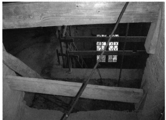
Abb. 2: Deckendurchbruch über drei Geschosse zum Einbau einer neuen Treppe vom Untergeschoss ins 1. Obergeschoss.