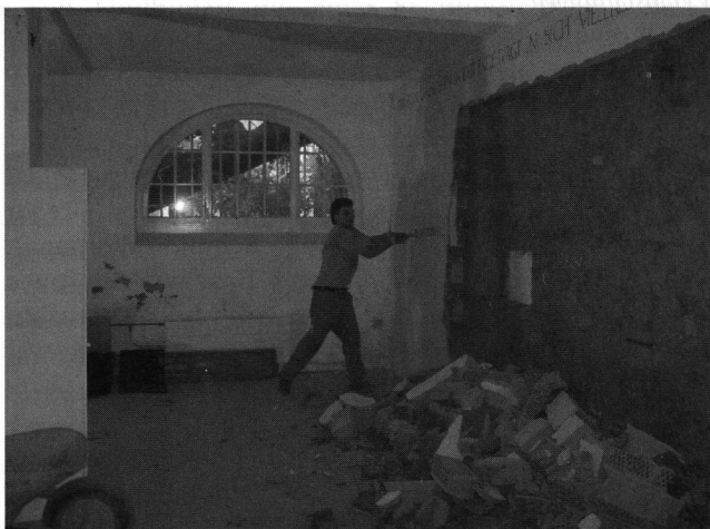
Abb. 1: Ausbruch einer nachträglich erstellten Zwischenwand im Untergeschoss zur Vergrösserung des Wechselausstellungsraumes.

Das Kulturgesetz des Kantons Aargau wird bekanntlich einer Revision unterzogen. Die GPV hat ihre Vernehmlassung abgegeben mit einem Schwerpunkt zur Zusam-