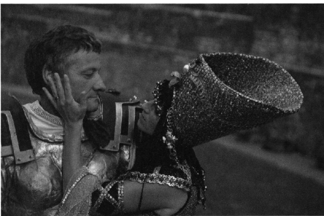
Abb. 1: Cleopatra verführt Julius Caesar im Spiel um Liebe, Macht und Reichtum. «Julius Caesar» IGAFS Sommer 2007.

Für das kommende Jahr konnten zwei viel versprechende Anlässe bewilligt werden: Die Kinderkonzerte kommen zum ersten Mal nach Vindonissa und das Aarg. Liedermacherfestival gastiert auch in der Arena. Zusammen mit dem Windischer Jugendfest freuen wir uns schon heute auf tolle Veranstaltungen im Amphitheater.