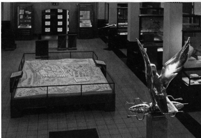
Abb. 2: Das Erdgeschoss des Vindonissa-Museums mit neu eingerichteter Dauerausstellung unter den Flügeln des nachgemachten Adlers der 11. Legion.