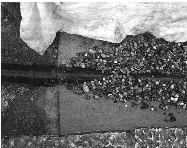
Abb. 1: Sickerleitung mit Einlauffläche hinter der mittleren Ringmauer.